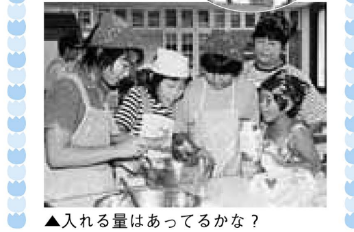
▲入れる量はあってるかな？

夏休み親子実験教室「プリンのひ・み・つ」 みんなでプリンを作りながら食品に含まれている添加物について学ぼう、という教室が消費者センターで開かれました。子どもたちは、初めて作るプリンを「手作りはおいしいね」と喜びの表情で味わいました。実験では、市販のプリンを温めたらどうなるかを観察。何が材料に含まれているかを学び、みな熱心にメモをとっていました。