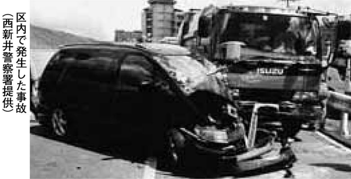
区内で発生した事故

●発行/足立区 ●編集/広報課 〒120-8510 足立区中央本町1-17-1 ☎3880-5111(代) FAX 3880-5610(広報課) http://www.city.adachi.tokyo.jp/ あだち広報は毎月10日・25日、 ズームアップは奇数月1日発行