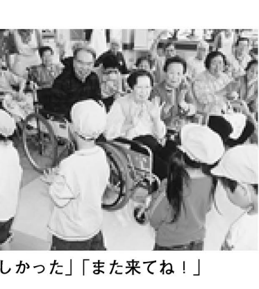
▲「楽しかった」「また来てね！」