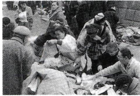
▲勝専寺境内でのボロ市の様子(昭和42年)

ボロとは、使い古して破れたりした衣服のこと。このボロを売買する市が、千住の勝専寺を中心に行われていました。ボロ市の由来は定かではありませんが、一説には「参勤交代の大名や旅人が、江戸による前の千住宿で正装に着替えたため、その