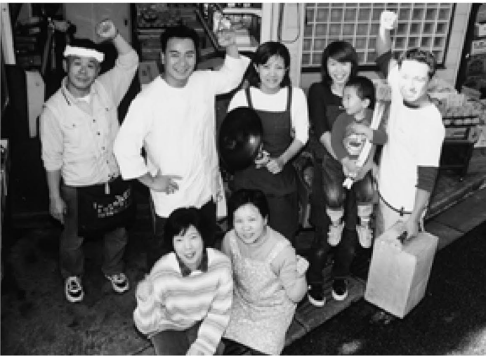
国民年金で老後も安心！お店も順調！