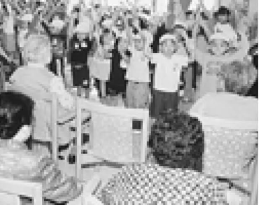
▼園児全員で「よさこいソーラン節」

歌や踊りを一生懸命に熱演。最後に「いつまでもお元気でいてください」とあいさつすると、その元気をもらったホームの皆さんが手を振ってこたえていました。