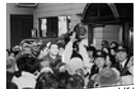
▲沿道に集まったファンは6,000人にも

12月10日、大関に昇進した足立区出身の栃東関が玉ノ井部屋のある梅田付近をパレード。多くのファンの祝福を受けました。