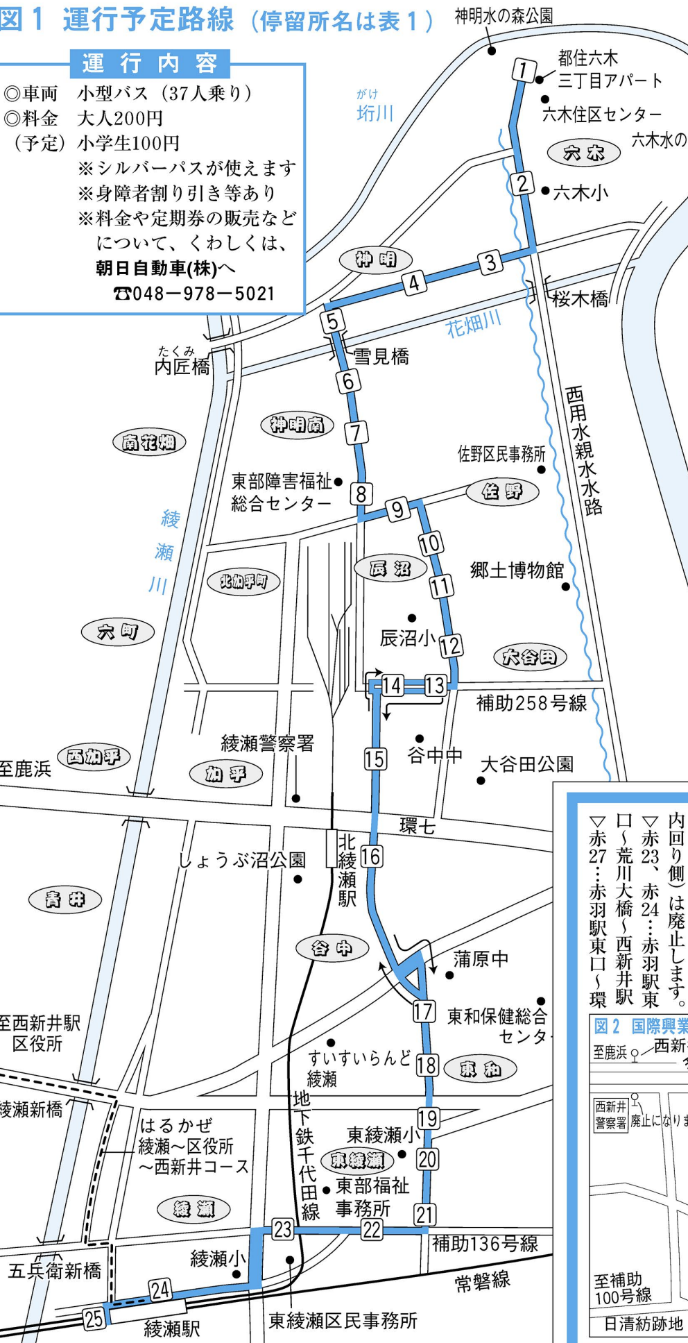
表1 はるかぜ停留所一覧

この路線により、綾瀬駅バスターミナルから東綾瀬小学校、東部障害福祉総合センターを経て、六木都住までの約6.5kmが約25分で結ばれます。