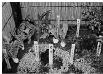
▲春の七草展示会(14年1月5日~15日、区民ロビーで開催)

七草がゆを食べ、一年間の無病息災を祈りながら、三世代交流を図ります。日時14年1月9日(水)、午後3時 対象1幼児(保護者同伴)、小学生、一般 申込1当日直接会場へ 費用1無料 場・問先1郷土博物館 ☎(3620) 9393