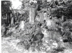
▲大川町水川神社の富士塚(千住大川町12-3)

足立の今昔 富士塚 初夢として、縁起がよいとされている富士山。その富士山にまつわる場所が区内に存在します。それは富士塚と呼ばれる、人為的に小高く盛り土や積み石をした塚です。