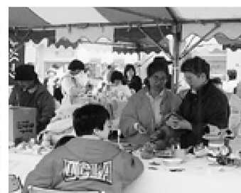
▲リサイクル工作(綾瀬川クリーンキャンペーン)

10月28日、東綾瀬公園で、綾瀬川を魚のすみきれいな川にようみがえらせようとキャンペーン