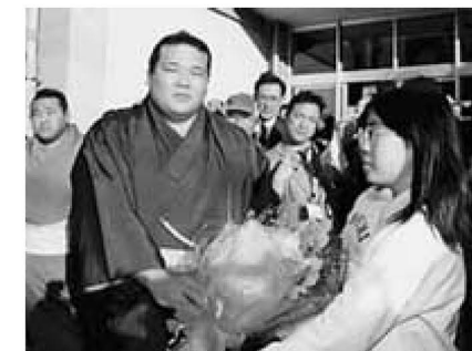
▲地元の小学生から花束を受ける