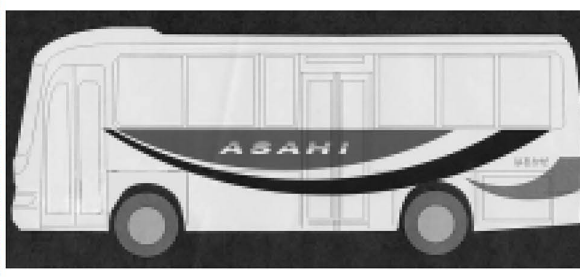
▲バスのデザイン(イメージ図)

◆足立区のコミュニティバス 事業の進め方は、バス事業者が独自に運行し、区が走行環境などの整備を行う方法です。新しく走るバスは、小型で小回りがきき、昇降リフト付きです。このため、地域のコミュニティ育成に役立つとともに、障害のある方も安全に乗り降りできる、便利で快適なバスです。