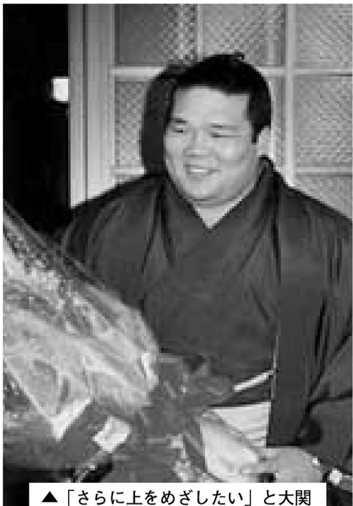
▲「さらに上をめざしたい」と大関

ですが、私にも作れそう」という声がかれました。 また、近所の方でつくる押部西公園清美会は自主管理団体として水と緑の公社に登録しています。押部西公園で掃き集めた落ち葉を、公園の一角で腐葉土