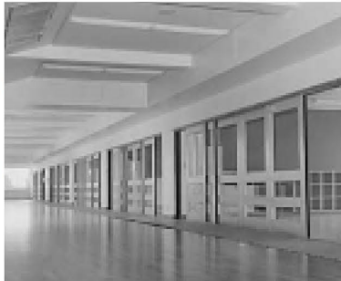
▲安全性も重視した、開放的な校内

見通しの良い教室 理科室などの特別教室をはじめ各教室は、安全面を考慮し廊下から教育活動が見学できるよう、見通しの良い開放的な施設になっています。