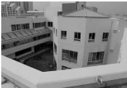
▲中庭を囲む、回廊式の校舎

多目的ワークスペースの設置 多様化する学習形態に柔軟に対応できるように、普通教室と一体的な利用ができるワークスペースを設置しました。