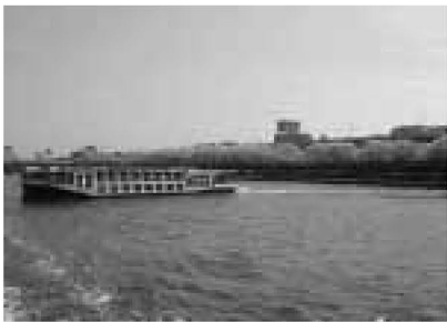
▲隅田川の桜も楽しめる、リバーウォッチング

「希望」と明記 ※ハガキ1枚で3人まで申し込み可。返信ハガキの表に代表者の住所、氏名を必ず記入してください。重複申込は無効 期限 3月8日