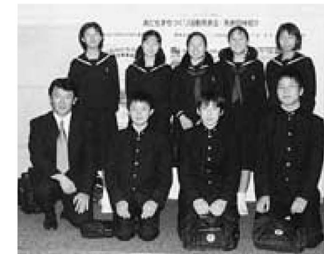
栗島中生徒会の皆さん

校舎の周りがある4つの大きな掲示板で紹介される、研究や行動の成果などの様々な情報発信が楽しみです。