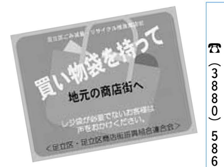
▲キャンペーンのステッカー

日時：3月10日(日)、午後1時〜2時 場所：千住旭町商店街/北千住サンロード商店街/東和銀座商店街/青井兵和通り商店街/竹の塚東口商店街/四三通り商業会(内容)：会場での商品券に買い物袋(または、かご)を持って来た先着100人の区民1人につき区内共通商品券50円分をプレゼントします ※当日は、区民グループによるキャンペーン行動も行われます