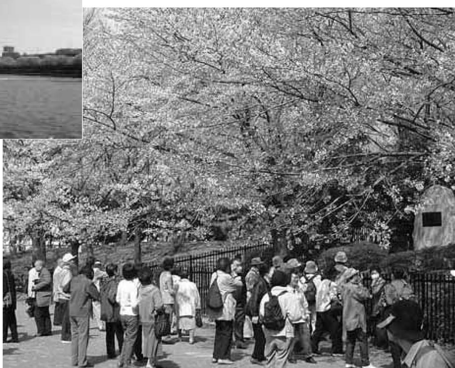
▲桜めぐりの様子(舎人公園レーガン桜:13年4月撮影)