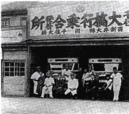
▲昭和7年当時のバス会社