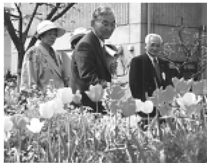
▲審査員も思わずニッコリ

4月3日、区内の町会や学校などが参加して、「春の花いっぱいコンクール」が行われました。花壇はチューリップ、ポピー、パンジーなどで彩られ、チヨウウやミツバチも春の香りに誘われていました。このコンクールは、花壇を花で飾り、明るく美しいまちづくりをめざすものです。参加者は「コンクールの時期だけではない、一年中地域に四季折々の花や緑を絶やさない工夫をしている」と話していました。このコンクールは秋にも行われ、花の生育状況や植え方などを採点します。