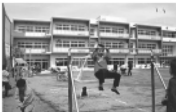
▲学校がいつも見守ってくれている

完全学校週5日制、学校選択制度と子どもたちをとりまく教育環境が、大きく変わった4月。島根小学校では、2年間の校舎改築工事を終え、元気に新学期を迎えました。白を基調とした外壁、「木」のぬくもりと優しさを感じさせる校舎内からは、今日も子どもの明るい声がひびいています。