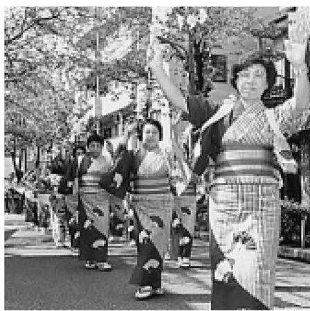
▲柳原のさくらまつりでは、流し踊りが華やかさをそえました

4月3日、区内の町会や学校などが参加して、「春の花いっぱいコンクール」が行われました。花壇はチューリップ、ポピー、パンジーなどで彩られ、チヨウウやミツバチも春の香りに誘われていました。このコンクールは、花壇を花で飾り、明るく美しいまちづくりをめざすものです。参加者は「コンクールの時期だけではない、一年中地域に四季折々の花や緑を絶やさない工夫をしている」と話していました。このコンクールは秋にも行われ、花の生育状況や植え方などを採点します。