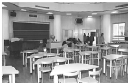
▲八角形のおしゃれな音楽室

ファクス・音声情報サービス 区政情報をお好きなときに手に入れ、聞くことができます 専用電話 ☎3889-3399 ファクスの場合「はるかぜ」時刻表は…コード1537 救急指定医療機関名簿は…コード1101