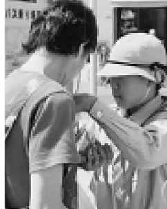
▲募金をしてくれた方には、緑の羽を

都指定のNPO法人「木もく倶楽部」が、区内の子どもたちを対象に「みどりの少年団」を結成しました。木もく倶楽部は、主に野外での遊びや森林教室などを通して、子どもたちに様々な体験学習の場を提供しています。4月1日、「緑の少年団」として初めて、西新井駅前で「みどりの募金」活動をし、大声で道行く人に募金を呼びかけました。