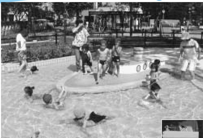
北鹿浜公園「船が目印だよ」