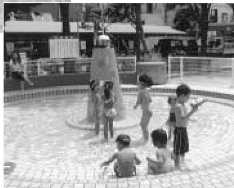
▲南宮城公園「噴水塔から水が出るよ」

お子さんたちが安心して水に親しめるように整備された施設が、じゃぶじゃぶ池。もちろん