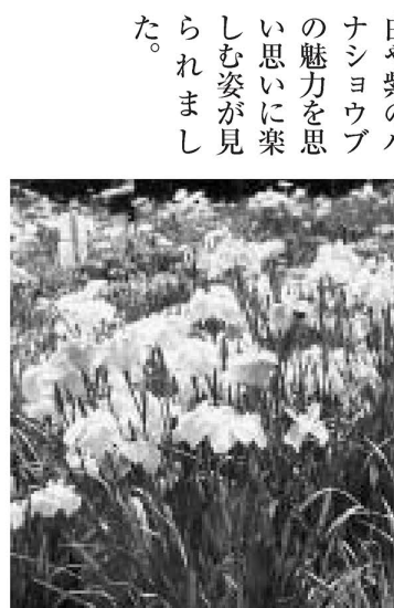
▲引き込まれる美しさ