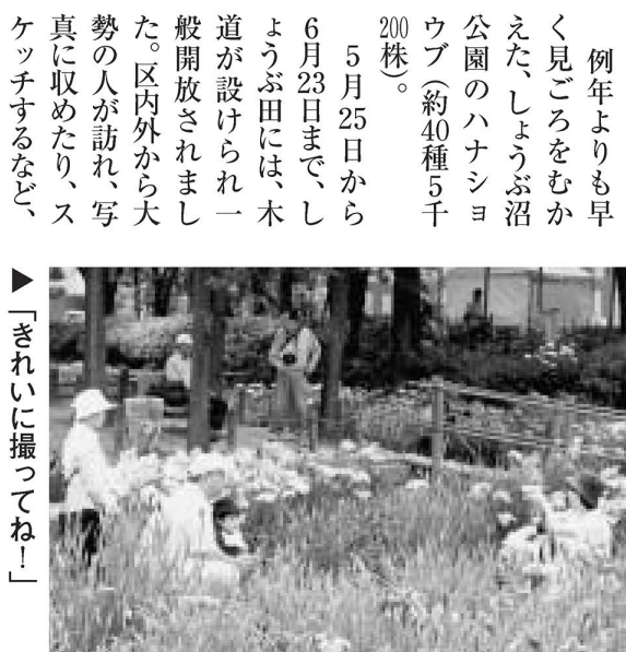
▶「きれいに撮ってね!」