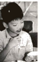
▲染め出し液を使って歯の汚れをチェック

8月21日、竹の塚保健総合センターで、「歯と口の観察図鑑をつくらう!」が行われました。親子づれ約40人が参加し、顕微鏡で口の中の細菌を拡大してモニターで見たり、歯型を取ったり、正しい歯みがきの仕方などを教わりました。参加した親子からは、「口の中の細菌を見てびっくり。歯の大切さがわかりました。これからは、今以上にきちんと歯みがきをします」と笑顔で話していました。 8月23日(土)25日(日)、子どもあきない体験塾が行われました。小学4年生から6年生までの13人が青果店などの店頭立ち、慣れないながらも接客を経験。どの子も始めは声が出なかった。「いらっしやいませ」も、だんだん大きな声で言えるようになり、最後は「買ってください」と売り込みました。「いつか、こういうお店をやりたい」と将来の夢のひとつになった子、体験からこういっただけ感想も寄せられました。