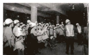
職員説明に熱心に聞き入る参加者たち

8月20日(日)、建設中のつくばエクスプレス青井駅(仮称)で「つくばエクスプレス夏休み親子見学会」が開催され、40組80人の親子が参加しました。参加者はヘルメットを着用し、途中、路線の説明や工事方法、現在の状況などについての話も聞きながら、地下1階の自転車駐輪場から地下2階のコンコース、地下3階のホームまで見学。子どもたちは、鉄道建設の様子もよくわかり、夏休みの宿題に役立ちそうだと楽しめた様子でした。