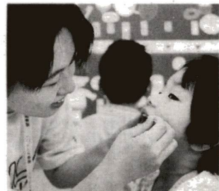
▲「お母さん、わたしの歯どうかな?」

月曜日~金曜日(祝日を除く)、午前9時~午後4時30分 ☎3880-5577 (教育委員会教育指導室内)