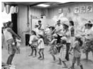
▲レッツ、ハワイアンダンス!

着々と工事が進むつばエクスプレス。17年度の開通をめざし、暑い日も寒い日も荒川の上で作業が続けられています。9月6日、区長をはじめ事業関係者によるボルトの締結が行われ、荒川橋りょうが連結されました。