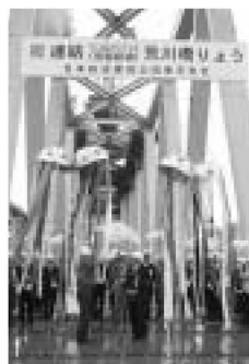
▲小雨の中での連結式