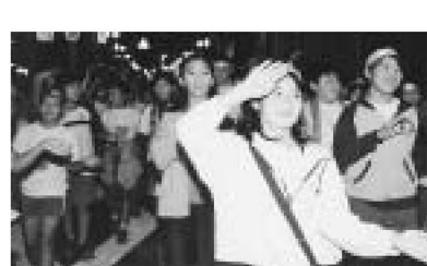
▲まちの子どもたちも、元気に流し踊りに参加

「おばけ煙突」など、なつかしいまちの風景が歌詞に織り込まれた元祖「足立音頭」が、この日復活。「おかめ・ひよっこ元気連」などの千住の皆さんによる流し踊り