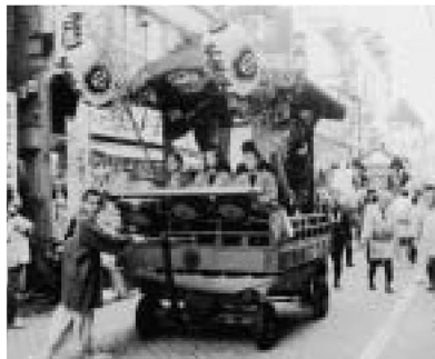
▲お祭りにはお囃子!

区内には、各地に囃子、神楽、獅子舞など、多くの芸能の団体があります。なかでも、祭囃子は31団体が区の保存会に加入しています。その起源は明らかではありませんが、100年以上にもわたって連綿と伝えられています。