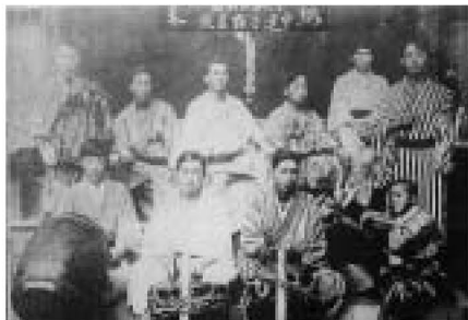
▲お祭りは若者たちの連帯を深めるものであり、娯楽でもあった(糺屋囃子連中)

区内には、各地に囃子、神楽、獅子舞など、多くの芸能の団体があります。なかでも、祭囃子は31団体が区の保存会に加入しています。その起源は明らかではありませんが、100年以上にもわたって連綿と伝えられています。