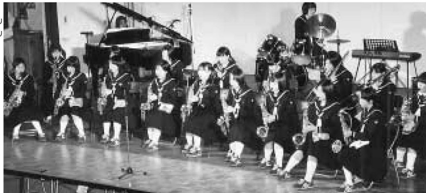
凛々しい演奏に会場も感動

今回千寿第八小は、初めてマーチングバンドで出場。踊りとフラッグが加わりオープニングを飾りました。その後体育館に会場を移し、千寿常東小、一中、二中、十六中の子どもたちが次々にレベルの高い演奏を披露。第二部は「デキシーキングス」の演奏で、会場は大いに盛り上がりました。生の演奏を身近かで聴くチャンス、ぜひ来年は足を運んでみませんか。