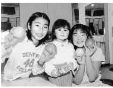
りんごの娘たちも、りんごの香りです。