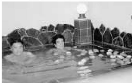
りんごの香りです。リフレッシュ

のんびり、ゆったり、よい香り。広い湯船に浮かぶりんごは、姉妹都市の長野県山ノ内町から届けられたものです。城東五区浴場連合会が一斉に行ったイベントは、11月24日の「りんご風呂」区民72カ所の銭湯は、JA志賀高原の協力で用意されたりんご風呂です。この香りにつつまれましょう。手足をぐっと伸ばし、日ごろの疲れがとれる銭湯は、いろいろな出会いのあるところ。ぜひ出かけてみませんか。