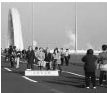
記念にハイポーズ