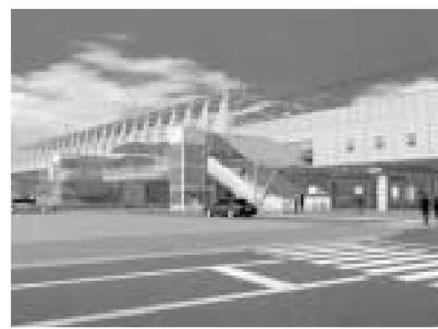
▲守谷駅(仮称)南東側イメージ図

グループ活動の会議録を公開します。区ホームページまたは直接お問い合わせください。 基本構想に関する意見をお待ちしています。 電話・手紙・ファックス・Eメール (seisaku@city.adachi.tokyo.jp) など、いずれでも結構です。また、ホームページに基本構想専用の掲示板を設けてあります。意見を書き込んだり、区民同士での意見交換などにもご利用ください。 お問い合わせは政策課へ 〒120-0510 中央本町1-17-1 ☎(3880) 5812 ☎(3880) 5610 http://www.city.adachi.tokyo.jp/