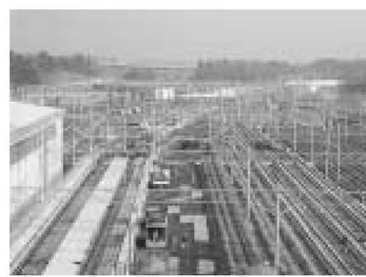
▲春には新車両が見られる車両基地