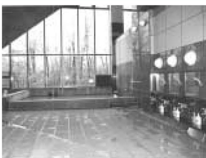
▲那須・森の家の浴室(温泉)

申し込みは、生涯学習振興公社の各施設で受け付けます。申込Ⅱ公社の各施設で販売する申込ハガキ(50円)に、必要事項を記入し、郵送または持参(1グループ1枚のみ) 期間Ⅱ3月1日～10日必着(抽選結果を3月末日までに郵送します) 当選者受付Ⅱ4月10日までに公社の各施設で利用手続きをしてください(この期間を過ぎるとキャンセル扱いになります)