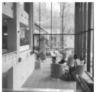
▲那須・森の家 ロビー