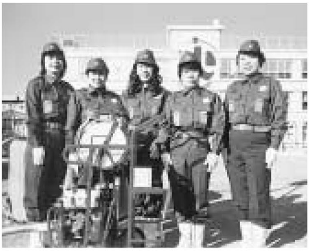
千住大川町東町会女性消防隊の皆さん