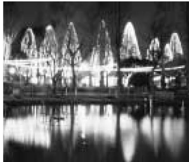
▲光の祭典(元湊江公園)

◆その1 9月現在の会員の中から、抽選で50人に、素敵な観光協会50周年記念グッズをプレゼント。 ◆その2 休日のツアーも企画していきます。