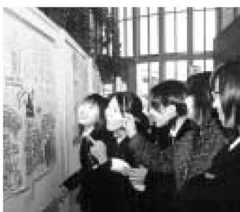
▲区役所1階アトリウムの展示風景

また、足立区議会からも同趣旨の意見書の提出をいただいているほか、同様の行動が多くの自治体などからも行われていま