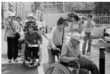
▲車いす利用者の視点で、まちの便利度を点検

民生委員・児童委員は、地域の皆さんの近くにおいて高齢者、障害者、児童問題、ひとり親家庭、低所得などで困っている方から広く相談を受けています。その際、必要に応じて区をはじめとした関係機関と連絡、連携を取りながら問題の解決に向けて努力しています。 14年4月から15年2月までに区内の民生委員・児童委員に寄せられた相談件数は1万962件、活動日数は延べ4万8千45日、訪問回数は延べ2万3千350回です。身近な地域福祉の問題に広く取り組んでいます。