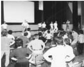
▲リズムに合わせて

転ばぬ先のオリジナル「転倒予防体操」できました! 浴室など家の中で転んで寝たきりに…。高齢者の寝たきりになる要因の1割は転倒によるものです。 「寝たきりにならないように」と、六月地区の健康づくり自主グループがオリジナル体操を完成させました。 都立保健科学大学教授の指導を受けて作ったこの体操は、筋力をつけ、体のバランスを良くします。 6月2日、庁舎ホールで発表があり、330人の参加者も実際に体験。みんなで一緒に体操すれば、転びにくい体と、明るく楽しい時間が持てますよ。