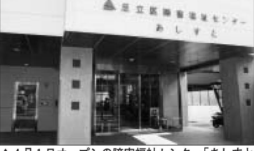
▲4月1日オープンした障害福祉センター「あしすと」

14年度下半期 財政運営の状況 14年度上半期の一般会計予算額は千78億円で、第一次補正後、その後2回の補正予算を組み38億を増額し、14年度の最終予算額は千25億となりました(表1)。 補正予算の主な内容 ▽災害用学校備蓄物品庫の設置(14年度ですべての小・中学校へ配備完了) ▽高齢者が在宅サービスセンターへ緊急整備助成 ▽北千住駅西口地区再開発(シシアター1101)建設 ▽区議会ホームページ開設 ▽風しん予防接種の実施 ▽千住仲町創業支援館「はばたき」開設準備 ▽商店街空き店舗利用の学童保育室開設準備 ▽障害福祉センター「あしす」と「開設準備 ▽バス路線増設に伴う庁舎ロスター1整備