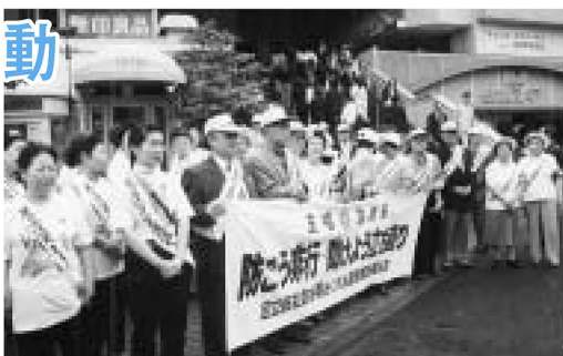
▲昨年の西新井駅前での広報活動

区内では7月から8月にかけて、区内各地でミニ集会や講演会などを行い、「社会を明るくする運動」の輪を広げていきます。皆さんの参加をお待ちしています。 ◆駅前広場活動 日時：7月1日(火)、午前8時 内容：北千住・練原・五反野・西新井・竹ノ塚の各駅前で広報用品を配布し、キャンペーン活動を行います。