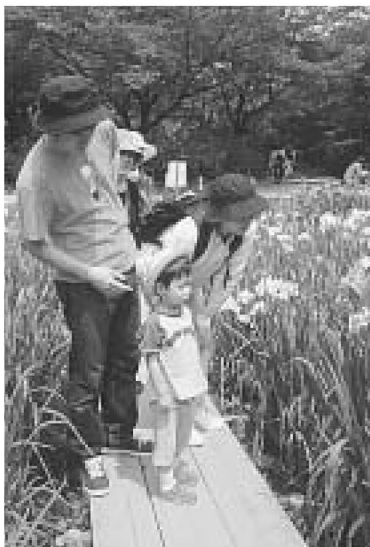
▲「背の高さが同じくらい…」

6月7日・8日、しょうぶ沼公園で「しょうぶまつり」が開かれ、多くの人でにぎわいました。29日までしょうぶ田に設置されている木道では、美しく咲く紫や白のハナシヨウウブを間近で観賞できます。一度お出かけになってみませんか。