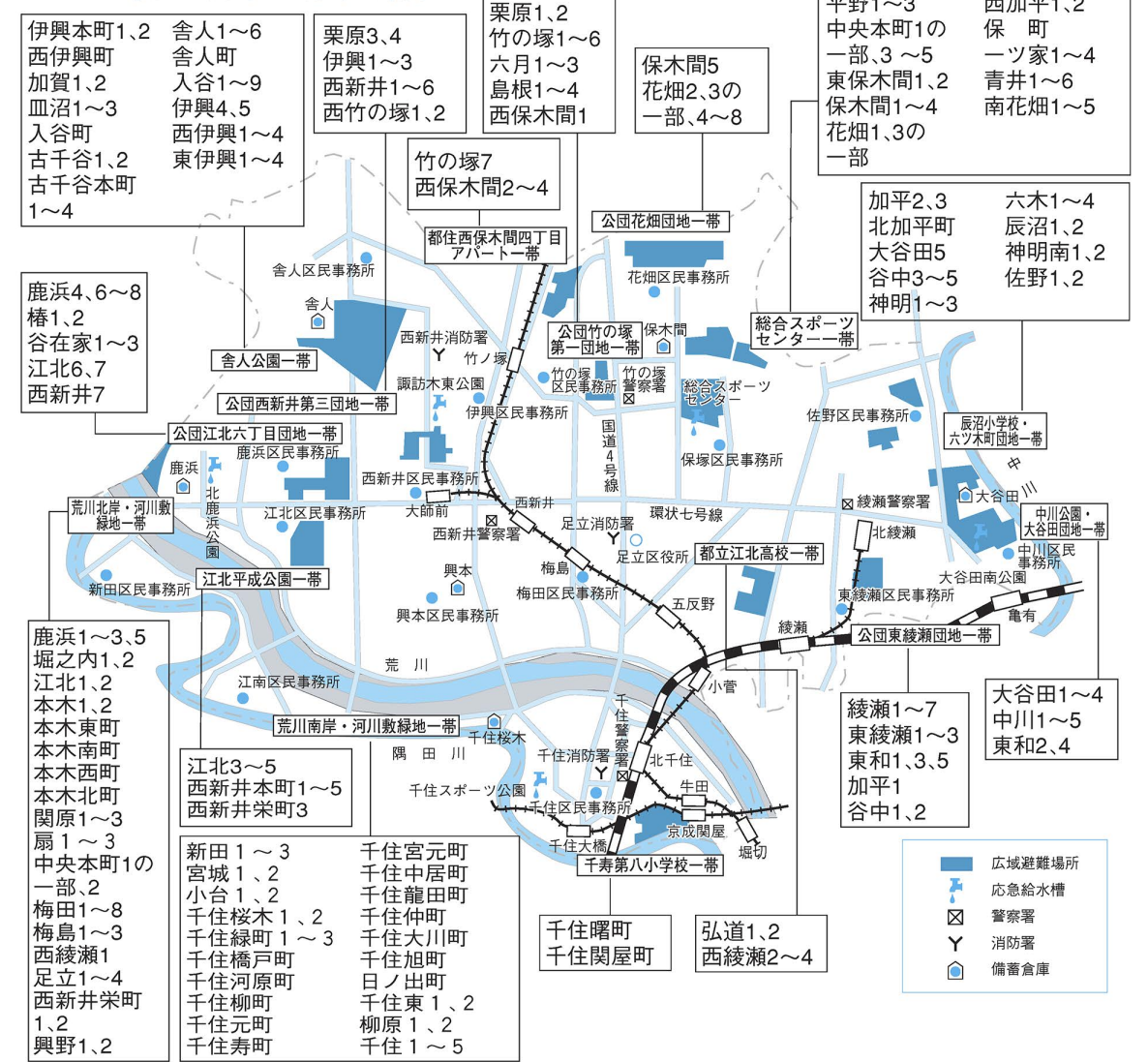
図1 大震・火災時の避難場所案内図

広域避難場所とは、大地震などで延焼火災が発生した場合、大火から身を守るために避難する場所です。15年2月、区内の広域避難場所が6カ所追加され、15カ所になりました(図1)。皆さんの地域の広域避難場所を確認してください。