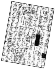
▲悪質な差別ハガキの一部...差別ハガキに関する情報をお寄せください

同和問題(部落問題)の運動団体関係者に対し、同和地区出身者を誹謗・中傷するハガキが大量に送りつけられるという事件がありました。ハガキは関係者の家の周辺にも送付され、大変悪質なものとなっています。ハガキには、「住めないようにしてやる」「人間でないで人権なんてない」など、卑劣極まる内容が書かれています。また、差別ハガキだけでなく、注文していない物品などを代金引換で送りつけるという嫌がらせも起