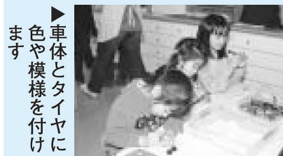
車体とタイヤに色や模様を付けます

開館時間 4月～9月：午前10時～午後6時 10月～3月：午前10時～午後5時 対象 就学前の乳・幼児(保護者同伴)から18歳までの子どもと、子どもに関わる大人 休館日 日・祝日、年末年始、館内清掃日(一部の児童館) ・東伊興生活館・桑袋地域集会所は、月曜日も休館