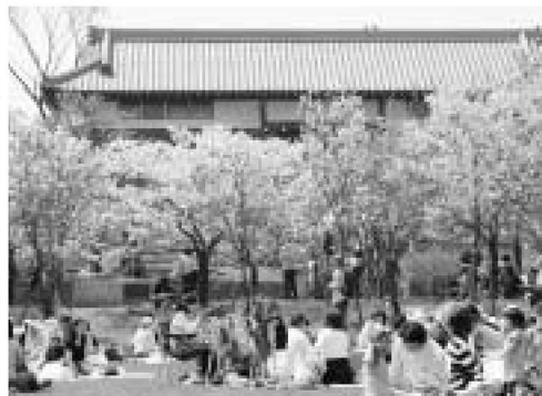
当は春の味 五色桜に囲まれて食べるお弁当

4月11日、都市農業公園で春の花まつりが開催されました。園内には、五色桜やチューリップ、菜の花など春を感じさせる花々が咲き誇り、訪れた人はそれぞれに春を満喫していました。これからの季節は新緑を楽しむことができます。