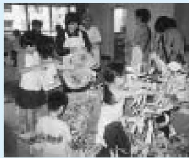
▲「新聞紙で遊ぼう」は子どもに人気です

年齢が違って、ドッジボールやコマなど、子どもたちは一緒に汗をかきながら、毎日元気いっぱい遊びまわります。いろいろな材料や道具を使い、工作や手芸、料理などもあります。自分で作った作品は世界に一つだけの宝物、料理の味は格別です。