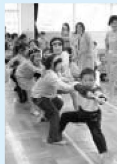
オーエス、オーエス、負けないぞー