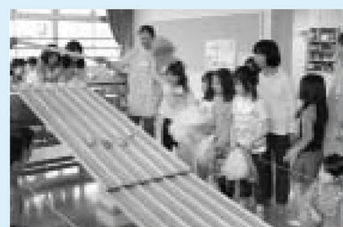
▲職員手作りのサーキット。だれの車が速いかな