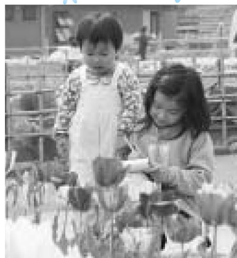
▲「おねえちゃん、チューリップ描いたら遊ぼうよ」