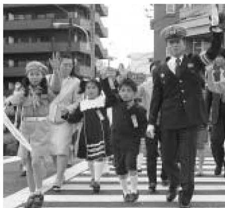
▲交通ルールを守って元気に学校へ行くよ

春になると真新しいランドセルを背負った新1年生を見かけます。そんな子どもたちに交通安全の大切さを教えようと、千寿小学校の入学式後、千住警察署の協力で「新入学児童横断訓練」が行われました。