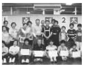
▲年齢差があっても友達です

経験豊かな人生の先輩から囲碁・将棋や卓球などを教えてもらい、世代を超えて親しくなっています。