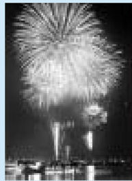
開今年は7月29日に開催予定

なお、作業に支障をきたすもの、危険と判断されるものは、撤去します。安全な花火大会実施のため、ご協力をお願いします。問先=観光協会事務局(経済観光課内) ☎3880-5853