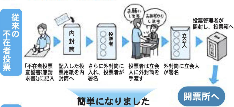
図2 不在者投票から期日前投票へ

7月11日に参議院議員選挙が行われます。東京都選出議員は、定数8人のうち半分の4人が改選となります。 選挙公報は、7月9日までに全戸配布するほか、各区民事務所にも置きます。また、区内各駅には選挙公報スタンドを設置します。 投票所入場整理券 投票所入場整理券を、6月22日に発送しました。 整理券は折りたたみ式で、表と裏の両面を端からはがして開きます(図1)。雨などでぬれてしまった場合は、よく乾かしてからがしてください。同じ世帯で5人分まで印刷されています。投票の際は自分の券を切り離し、持参してください。※もしも整理券が届かなかったり紛失した場合でも、選挙人名簿に登録されていれば投票できますので、投票所係員に申し出てください。