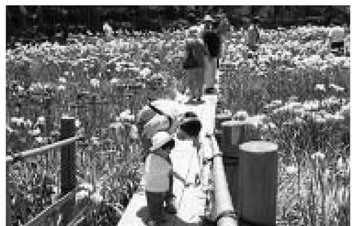
▲「このお花きれいだね」

今年は花を見ながら東綾瀬公園まで歩いて行くウォークラリーも同時開催。家族そろってチャレンジする姿も多く、スタンプを集めたり、景色を見たりと、みんなで楽しみながら歩きました。