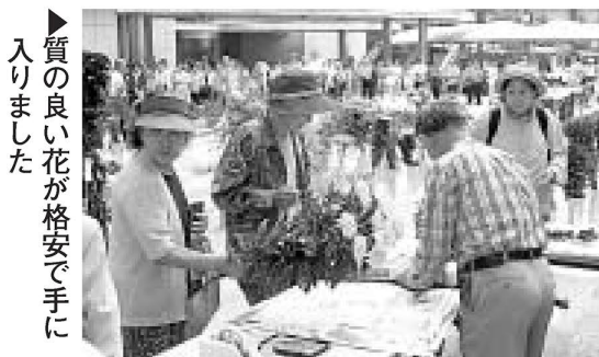
質の良い花が格安で手に入りしました

10日は、毎年好評のチャリティー販売。販売開始前から長蛇の列ができました。販売が始まると、気に入った花を手に取り、うれしそうに見つめる表情が会場にあふれました。