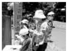
▲天気に恵まれ、ウォークラリーも人気でした

6月5日・6日、しょうぶ沼公園で「しょうぶまつり」が開催され、多くの人を訪れました。特に5日は晴天の中、しょうぶ田に咲いた満開の花を訪れた人の目を楽しませていました。