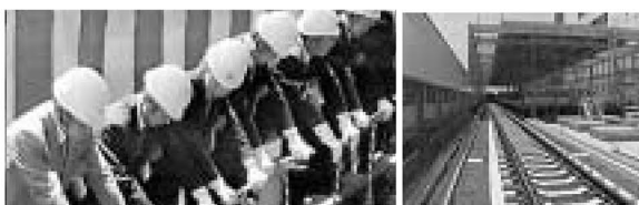
▲「えい、えい、えい」の掛け声で最後のボルトが締められ、新しい線路が完成しました

新車両が全線で走行試験を始めるのは11月から。年内には新車両の走る姿が見られる予定です。