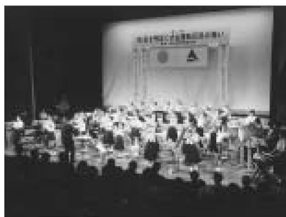
▲昨年の記念コンサート(伊興中学校吹奏楽部)

日時=7月14日(木)、午後1時 場所=区役所庁舎ホール 内容=区立青井中学校による吹奏楽部記念コンサート(15年度都中学校吹奏楽コンクール金賞、同アンサンブルコンテスト クラリネット5重奏金賞・管楽6重奏金賞受賞校。曲目は「Under The Sea」、「さよなら大好きな人」ほか) / 「社会を明るくする運動」中学生標語表彰式/抽選会ほか ※景品が当たります 定員=400人(先着順) 費用=無料 申込=当日直接会場へ