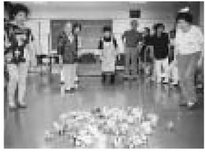
参加者が「あじさい」「花しょうぶ」チームに遊びに来てもらうため、老人部、婦人部の委員が話し合っ

ながら今日に至っています。プログラムはゲームのほかに歌、手話、ダンス、体操、そして血圧測定など盛りだくさん