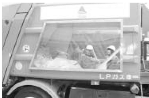
「清掃車の中ってこうなっているんだね」

児童は、職員の説明を受けた後、早速ゴミ袋を積み込むと、スイッチを操作したり、ごみの動きをのぞいたり、初めての体験に興奮しながら、興味深そうに学習していました。