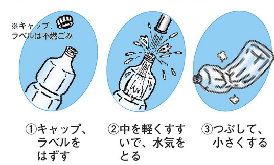
図1 ペットボトルの出し方

◆キャップをはずしてください キャップをしたまま夏場の高温にさらされると、キャップが飛び出す場合があります。キャップをはずしてからペットボトルを出すようにしてください。 ※キャップとラベルは不燃ごみへ 問先 リサイクル推進課 事業係 ☎(3880) 5862