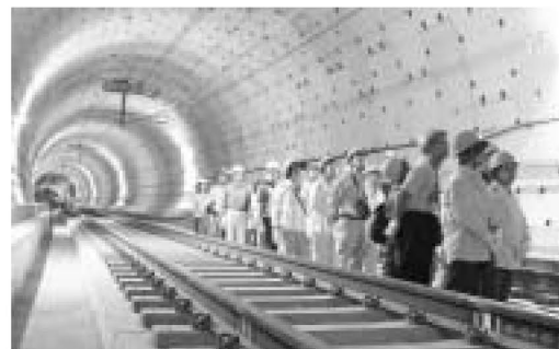
駅間の長さは約1.2km、深さは環状七号線の下で28m

参加者は「外は暑いのに中は肌寒いくらい」「暗くて楽しい」「電車が走り始めたら、同じ区間を乗ってみたい」など、開通後にはできない貴重な地下の旅を楽しみました。