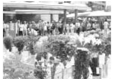
▲大盛況だった今年の春花展示会

日時=12月10日(金)、午後2時30分 場所=区役所正面広場 ※1人1点のみ。状況により整理券配布