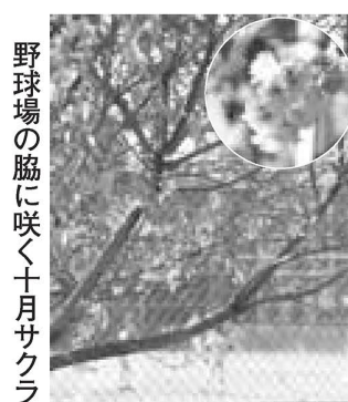
野球場の脇に咲く十月サクラ

世界エイズデー(12月1日)に合わせて、「HIVと人権・情報センター(NPO)」がエイズ電話相談を行います。 日時=11月27日午前10時~28日午後10時(36時間) 問先=フリーダイヤル ☎0120-545036 (上記電話が繋がらない場合) ☎33292-9090 ▷英語相談(English) ☎5259-0256