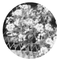
▲アリッサムは、香りのあるかわいらしい花です

開花を早める促成栽培。昼間の一定時間覆いを掛け、日の当たる時間を短くし、花芽を早く作らせる方法