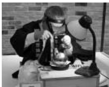
▲ものづくりフェスタでの実演の様子(東京銀器)

※入場無料。初日(6日)は9時からオープニングセレモニーあり。工芸品展では、匠の技体験教室も行います(材料費実費負担)。時間など、くわしくはお問い合わせください