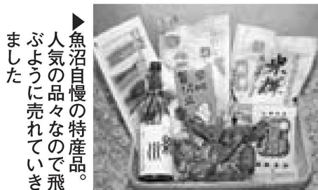
魚沼自慢の特産品。人気の品々を売ってあげました。