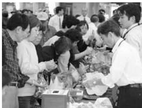
▲大勢の方が訪れたフェア。少しでも被災者の方々の役に立ちますように

小・中学生のいじめ相談 月曜～金曜日(祝日を除く)、午前9時～午後4時30分 ☎3880-5577 (教育委員会教育指導室内)