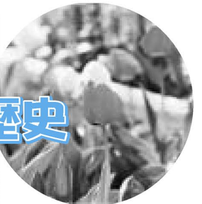
▲区の花チューリップストックは、春ごろまで楽しめます

足立の花は江戸時代後期以降、仏花を中心とした花の栽培が行われてきました。大正時代以降に、足立の花き農家が促成の栽培方法を発案したことから、チューリップなどのフレーム栽培(注1)やキクのシェード栽培(注2)は、足立の花き栽培の代名詞となり、今も一部で受け継がれています。