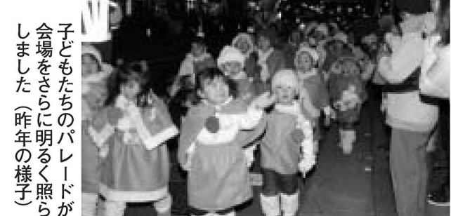
子どもたちのパレードが会場をさらに明るく照らしました(昨年の様子)