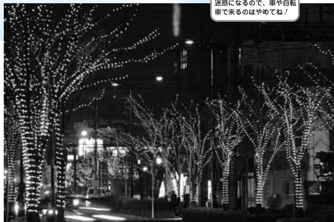
▲元洲江公園までの街路樹に輝やかな光が灯ります(昨年の光の祭典から)