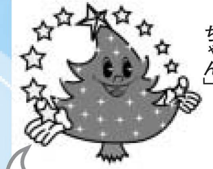
光の祭典・イメージキャラクター「アキラちゃん」 会場周辺は、住宅街です。迷惑になるので、車や自転車では来れませんのでね!

主要2会場以外でも、光の演出を楽しめます。 ●足立区役所ロータリー イルミネーション点灯日時=12月10日~17年1月10日、午後4時30分~10時 ※12月10日、午後5時20分から区役所庁舎ホールで点灯式を行います ●ベルモント公園(梅島1-33) ライトアップ点灯日時=12月10日~25日、午後4時30分~9時