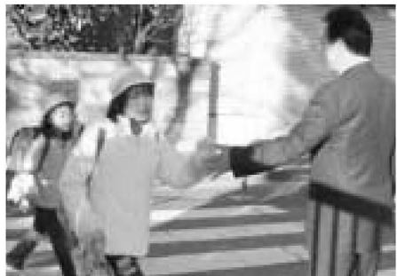
▲登校時に校長先生とハイタッチ。元気な1日はここから始まります