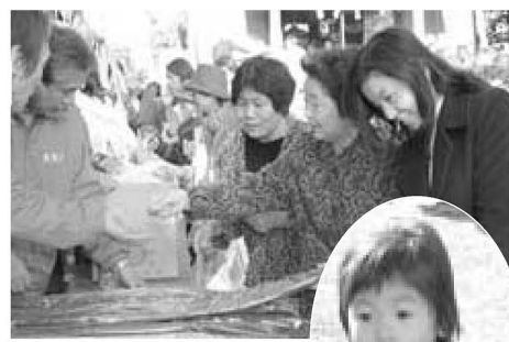
▲たくさんの野菜を購入する人も

野菜の販売のほか、フリーマーケットや、19年度の開通をめざす日暮里・舎人線の車両をかたどった新線焼きも無料で振る舞われ、お腹も満足できた催しとなりました。