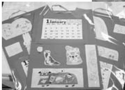
▲私のカレンダーが一番かわいいかな?