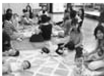
▲子育ては一人で悩まず、みんなで支え合い、楽しく行いましょう

保健総合センターの事業で知り合ったお母さんたちが、「子育て期間中を生き生き楽しく過ごそう」という気持ちを持ち合い、学習や交流をしています。同じ立場だからこそ共感し合えることも多く、ホッとできる大切な場です。ぜひ参加してください。