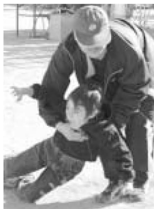
▲犯人役の迫真の演技に「助けて〜!!」

また、自転車運転教室などもあり、子どもたちは自分で実際に体験しながら、事件や事故の防止策を学びました。