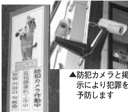
▲防犯カメラと掲 示により 予防します

るため夜間のパトロールを行っている 地域の安全を守るためには、区民の皆さん一人ひとりが「自分のまちは自分たちで守る」という意識を持ち、隣近所で協力し合うことが大切です。区も地域の皆さんと連携し、安心して住み続けられるまちをめざしていきます。