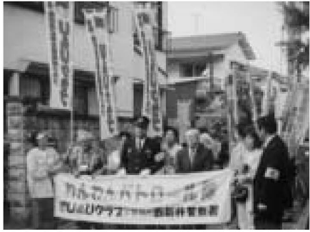
▲わんわんパトロール発足式

▽栗原町会：「地域安全パトロール隊」を結成、町会全域をおそろいのベストを着て巡回し、空き巣やひったくりなどに目を光らせています ▽千住地域およびU&Uクラブ(梅島・梅田地区総合型地域クラブ)：「わんわんパトロール隊」を結成、愛犬と共に地域の目として活動しています