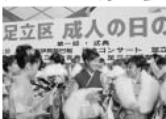
▲晴れ着姿で語り合うのは将来の夢?

1月10日、冬の澄んだ青空の下、東京武道館で「成人の日の集い」が行われました。今年、区内で6,320人(16年12月1日現在)が晴れの日を迎えました。