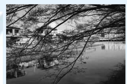
▲都の「武蔵野の道」のコースにも指定されている六木遊歩道から見た朽川