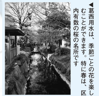
▲葛西用水は、季節ごとの花を楽しむことができます。特に春は、区内有効の桜の名所です

問先=▷記事内容について...広報係 ☎3880-5815 ▷史跡について...郷土博物館 ☎3620-9393 ▷文化財について...文化財係 ☎3880-5984