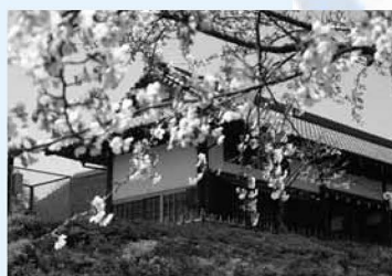
▲都市農業公園は、四季折々の花や長屋門・古民家があり、区民の憩いの場となっています