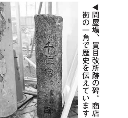
▲間屋場、貫目改所跡の碑。商店街の一角で歴史を伝えています

※地図は大まかにコースを示したものであり、実際とは道幅などが異なる場合があります。迷いやすい道もありますので、実際に歩くときは、地図を別途用意することをおすすめします