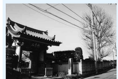
▲中川沿いの常善院。大きなイチヨウの木が目印。区の登録文化財が多い寺でもあります