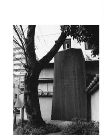
▲通りの完成を記念して建てられた大正記念道碑。撰文は森鷗外

コース=北千住駅西口~長門寺(めやみ地蔵尊)~氷川神社~名倉医院~(荒川・学びピア21)~大黒湯~旧NTT千住~大正記念道碑~千住スポーツ公園~橋戸稲荷~大橋公園~千住大橋(奥の細道出発地)~芭蕉像~千住宿歴史プラザ~稲荷神社~源長寺~間屋場・貫目改所跡~森鷗外旧宅跡~勝専寺(赤門寺)~本陣跡~北千住駅西口