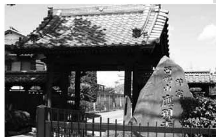
▲応現寺の山門は、江戸時代初期の建築様式が残り、区の有形文化財になっています