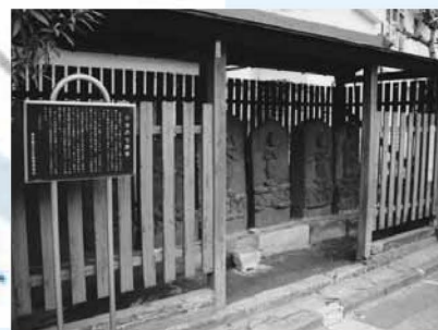
▲住宅街と土手の境にある小台の七庚申の庚申塔が庚申申。江戸時代の