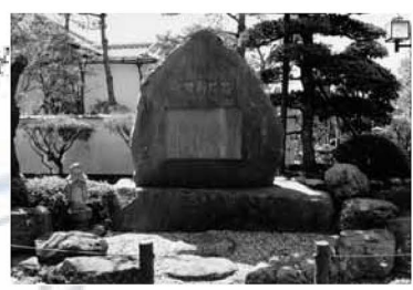
▲寺町の法受寺にある牡丹灯籠の碑