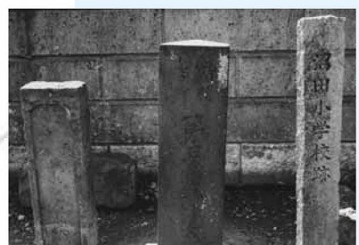
▲葉王院の参道にある石碑。葉王院は荒綾八十八カ所の一つ。隣には北野神社があります