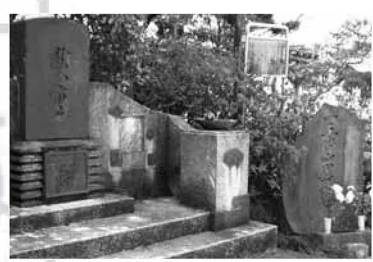
▲東岳寺にある、初代安藤広重の墓