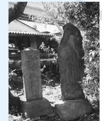
▲区内最古の現役の橋、熊木橋のそはにある石碑。江北大師道の起点と称されています