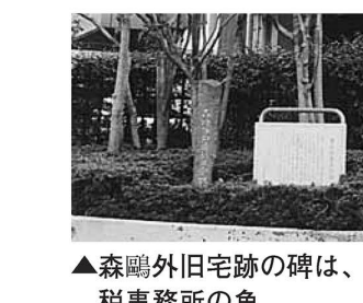
▲森鷗外旧宅跡の碑は、都税事務所の角