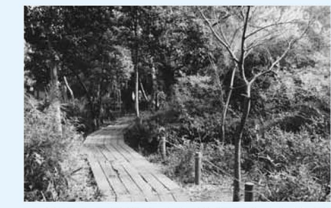
▲佐野家の屋敷は、周囲を幾百年も経た屋敷林で覆われ、現在は区立公園として一般に公開している。中には遊歩道があり、区民の散歩コースになっている

コース=亀有駅北口~古隅田川~円性寺~八か村落し堀~葛西用水~大谷田団地~常善院~柳野稲荷神社~佐野家屋敷~旧六木村周辺(六木水の森公園)~六木遊歩道~「六ツ木都住」から東武バス(有28)にて亀有駅北口