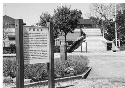
▲伊興遺跡公園。公園内には、古代の住宅を復元したものや、出土品を展示する展示館もあります

コース=竹ノ塚駅西口~東岳寺~白旗塚跡公園~毛長川~寺町~伊興遺跡公園~伊興水川神社(淵之宮)~保木間堀親水路~ほんの木橋~赤山街道~応現寺~若宮八幡神社~諏訪神社~諏訪木東公園~竹ノ塚駅西口