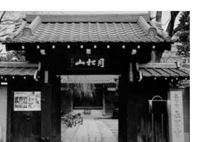
▲長門寺の門に架かる「月松山」の文字は、千住にあった寺子屋の校主の筆で、区の有形文化財