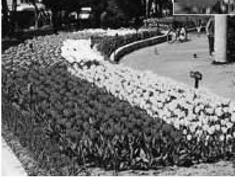
◀元洲江公園。まるで花のじゅうたんのようです