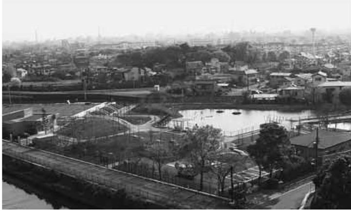
▲綾瀬川に隣接するビオトープ公園