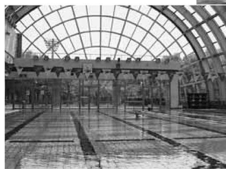
▲日差しが降りそそぐ開閉型ドーム

まだまだあります 区内の温水プール ▷スイムスポーツセンター・うきうき館(西保木間4-10-1) ▷千住温水プール・スイミー(千住3-30 千寿本町小学校内)