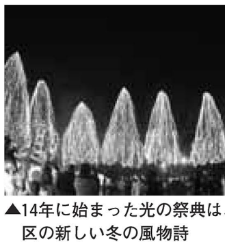
▲14年に始まった光の祭典は、区の新しい冬の風物詩

区ならではの地域資源を皆さんで発掘し、創意・工夫により観光資源化します。さらに各資源を最大限活用して、魅力ある「観光資源」へ育てていくことが大切です。