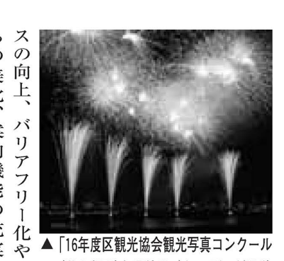
▲「16年度区観光協会観光写真コンクール(花火部門)」準特選

この特集については、お問い合わせは、観光交流課 お問い合わせは、観光交流課 観光計画へ 〒120-8510 中央本町1-17-1 ☎(3880)5720 ☎(3880)5603 ✉k-kanko@city.adachi.tokyo.jp