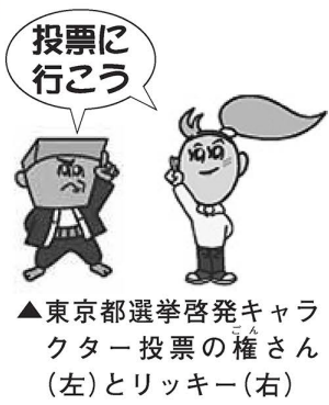
▲東京都選挙啓発キャラクター投票の権さん(左)とリッキー(右)

お問い合わせは、選挙管理委員会へ HP http://www.city.adachi.tokyo.jp/ ☎ (3880) 5581 ※投票日当日の投・開票の経過と結果は、区・ホームページに掲載します