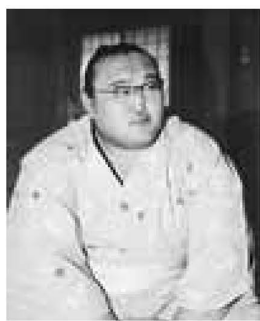
▲岩木山関。6月25日に期日前投票をする予定です

※区役所を除き、来場者の駐車場はありません。車の来場はご遠慮ください ※千住庁舎では、今回の東京都議会議員選挙から期日前投票所を設置しませんのでご注意ください