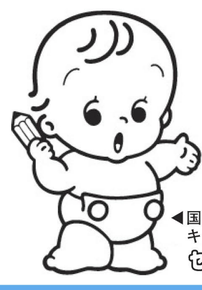
国勢調査キャラクター セツメ

10月1日、全国一斉に国勢調査が行われます。大正9年から5年ごとに行われていたこの調査は、住民登録の有無や国籍に関わらず、日本に住んでいるすべての人が対象となります。皆さんのご協力をお願いします。