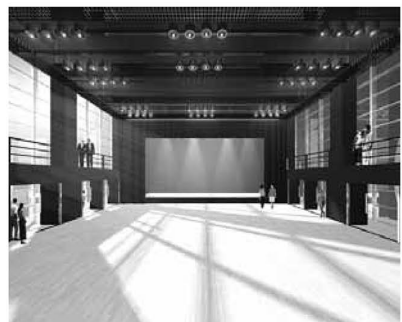
▲座席を収納したホール(予想図)

10月からホールの仮受け付けが始まります。オープンに先立ち、「東京芸術センター」の最上階に設置されるホールの仮受け付けを開始します。東京芸術センターは、区有地