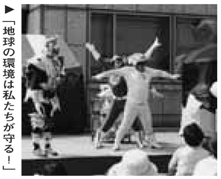
「地球の環境は私たちが守る！」

Oct.1(Sat.) ▷Korean... Tuesdays, Fridays, Oct. 2(Sun.) Inquiry period :From Sept.20 to Oct. 7(except national holidays)