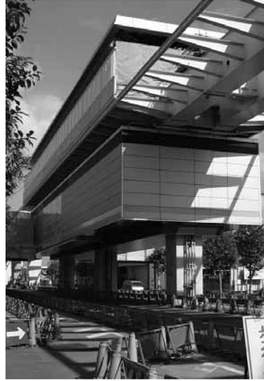
▲(仮称)上沼田東公園駅の駅舎。開通に向け工事は進行中です

日暮里・舎人線 環状七号線江北陸橋をまたぐけた架設工が始まります 18年1月中旬から、環状七号線江北陸橋をまたぐけた架設工が始まります。これに伴い、周辺では交通規制が行われます。工事期間中は、渋滞などが発生し、迷惑をお掛けしますが、ご理解とご協力をお願いします。