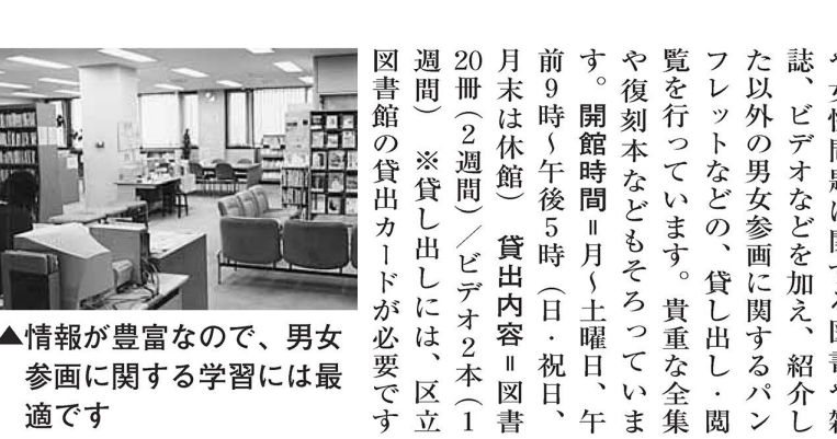
▲情報が豊富なので、男女参画に関する学習には最適です

区では、男女共同参画施策の進捗よく状況について審議し、意見を述べる機関として「足立区男女共同参画推進委員会」を推進しています。この委員会は、区民の意見を積極的に取り入れることで、多様な考え方を新しい事業展開に期待できると考えているからです。区では、16年に「審議会等の委員選任に関する運用基準」を作成し、団体に女性の適任者