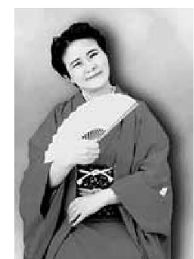
▲菊千代さんならではの手話がいったいどの落語

日時=12月6日(火)、午後2時～4時 ※午後1時30分開場 場所=区役所庁舎ホール 内容=人権ポスターコンクール表彰式(小・中学生)/中学生人権作文発表/古今亭菊千代さんによる手話落語 定員=486人(当日先着順) 申込=当日直接会場へ 問先=人権・同和係 3880-5497