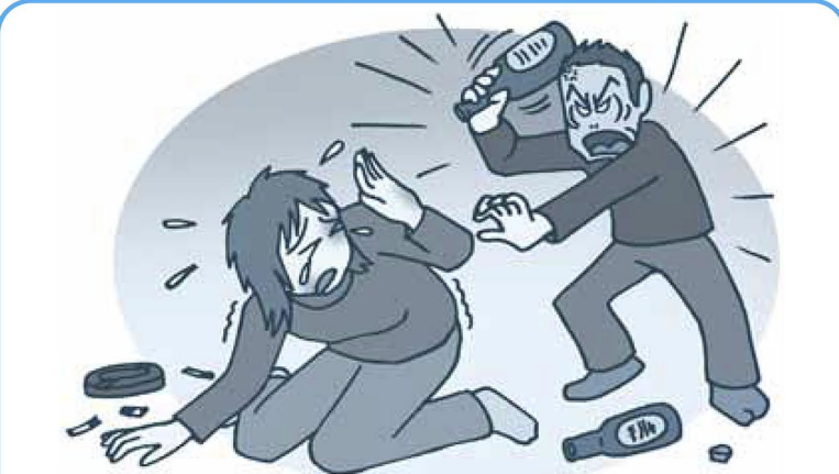
図1 多岐にわたるDV(例)

◆身体的暴力 殴る・蹴る・物を投げつける・包丁を突きつけて脅す・髪を引っ張るなど