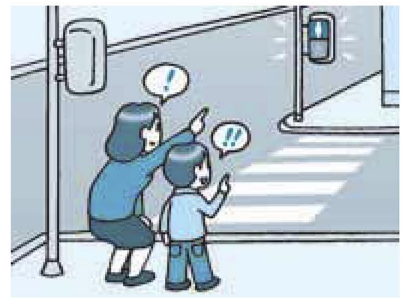
▲「信号をちゃんと確認するのよ!」基本ルールを教えましょう

この時期は、入園・入学により、今まで大人と一緒に歩いていた子どもが、一人で外を歩く機会が増えます。この機会に信号の見方、横断歩道の渡り方などの基本的な交通ルールを教えましょう。また、近所を一緒に歩きながら、外を歩くときには、どんなことに気を付けたらいいのかなど、子どもの目線で一緒に確認し、子どもが自分自身で、事故から身を守るといった習慣を身に付けさせましょう。また、子どもを車に乗せるときは、体格に合ったチャイルドシートを着用させましょう(図2)。