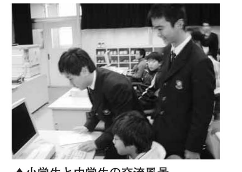
▲小学生と中学生の交流風景

現在の義務教育の小学校6年制・中学校3年制(6・3制)は、昭和22年に始まり、当時と比べると、子どもたちは心と身体の両面で成長・発達に変化が見られ、子どもたちの現実と6・3制の仕組みの間に、ずれが生じてきています。それが、いじめや不登校といった問題の要因の一つといわれています。 区では、仕組みと現実とのずれをなくし、様々な問題を解決していくための新たな試みとして、小中一貫教育校を開校します。 足立区の小中一貫教育 区では、子どもたちの発達段階に応じた教育をめざすと共に、小学校から中学校への進学をスムーズにするために、小中一貫教育校を開校することとなりました。この小中一貫教育校を実践するため、17年3月に「小中一貫教育による人間力育成特区」として政府の構造改革特区の認定を受けました。区の小中一貫教育では、「確かな学力の向上」と「心の教育の充実」を2本柱として、子どもたちの人間力を育成していきます(図1)。 小中一貫教育はなぜ必要? ●心と身体、両面の成長・発達に見られる変化への対応 思春期の特徴が始まる小学5年生と、思春期の特徴が顕著になる中学2年生を転換期としてとらえ、義務教育の9年間を、新たに4年・3年・2年のくりとします。 ●小学校から中学校への移行をスムーズに 小学校から中学校に進学する際の心理的抵抗感を克服できない場合は、勉強きらい・不登校など、様々な不適応が生じます。この抵抗感をなくしてスムーズに進学させ、新たな教科や学校生活に対する不安やストレスを解消していきます。 小中一貫教育のメリット ①9年間をおとしたカリキュラムにより、発達段階に応じた計画的・継続的な教科指導や生活指導が可能となります。 ②教科(算数から数学へなど)の難易度など、急激な変化を緩和できます。 ③幅広い異年齢集団によるいろいろな活動とおして、豊かな社会性や人間性を育成できます。 ④小学校から中学校へ進学する際のストレスを軽減することで、不登校の発生を予防できます。 ⑤小・中学校教員の相互協力関係ができることで、小学校と中学校がそれぞれ行う教育活動に比べ、学力向上などの高い教育効果を期待できます。