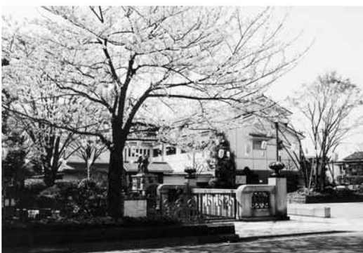
郷土博物館は、区内屈指のサクラの名所、葛西用水親水路沿いにあります

葛西用水親水路のサクラの開花に合わせて、月曜日に臨時無料開館します。日時 4月3日(月)・10日(月)、午前9時〜午後5時(入館は4時30分まで) ※郷土博物館では、「永沢まこと足立60景 つどい・にぎわい」を開催中(4月9日まで)