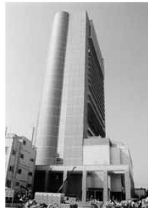
▶経営や創業の支援をするあだち産業センター