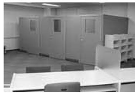
▲経営、融資、創業などの相談に応じます

あだち産業センターの開設に伴い、3月31日をもって区役所での各種相談窓口は終了します。ご注意ください。