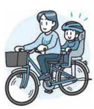
▲子どもを補助いすに乗せたら、ハンドルから絶対に手を離さない

子どもを自転車の補助いすに乗せたまま転倒した経験はありませんか。都が行ったアンケート調査によると、転倒時にけがをした子どものうち、約5割が頭部にけがをしています。子どもの頭部へのけがを防ぐには、ヘルメットの着用がとても有効です。ヘルメットの着用により、幼児の頭部に加わる衝撃が5~6割程度も緩和されるという実験結果も出ています。子どもを守るため、自転車に乗せるときは、ヘルメットをかぶせましょう。また、購入の際は、安全基準に適合したSGマーク付きで、子どもに合ったサイズのものを選びましょう。子どもを補助いすに乗せるときは最後に乗せ、降ろすときは最初に降ろしましょう。