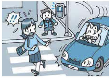
▲「あっ、危ない!」大人がルール違反をしてはいけません

子どもは予想外の行動をとりまします。外を歩くときの合言葉は「歩止まる 確かめる(右、左、左、右)」。赤信号なのに道路を渡つたりしていませんか。子どもは大人のまねをします。大人がしっかりと交通ルールを守ることが、子どもを交通事故から守ることになります。