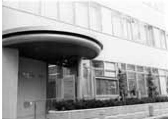
▲区の新しい産業の拠点となるあだち産業センター

足立区の新たな産業拠点です。区内の中小企業経営者や、これから創業を志す方を支援します。融資のあっせん、創業・経営相談、特許相談、産業情報の収集、販路拡大まで、ワンストップでのサービスを実現します。