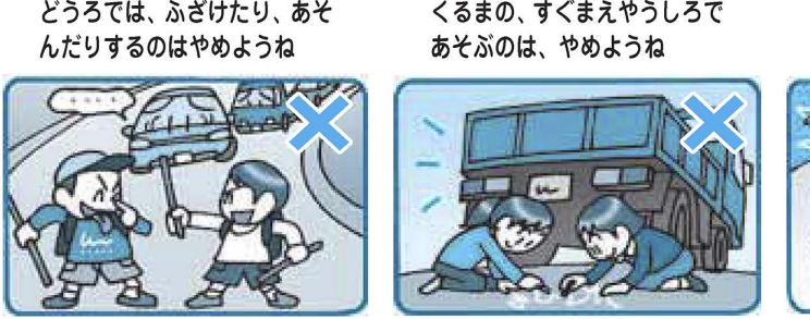
どうろでは、ふざけたり、あそんだりするのはやめようね