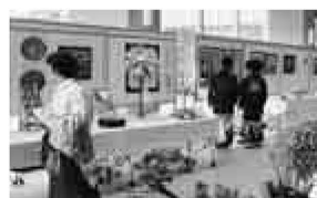
▲美遊展は区役所で開催

美遊展 「輝け未来の文化」 日程等II表2 内容II守り、受け継がれている伝統文化に触れられる、足立区文化団体連合会加盟団体の合同展示会 申込II当日直接会場へ