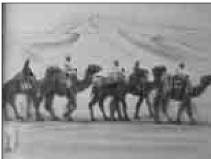
▲平山郁夫作「らくだ・砂漠行」

横山大観作「曙色」などの、 絵画が区に寄贈されました ※寄贈された絵画の公開は、来年の予定です 横山大観「曙色」、平山郁夫「らくだ・砂漠行」、東山魁夷「春光」など、一流画家の絵画 計7点が区に寄贈されました(表3)。時代が移り変わっても色あせない鮮やかな色彩に