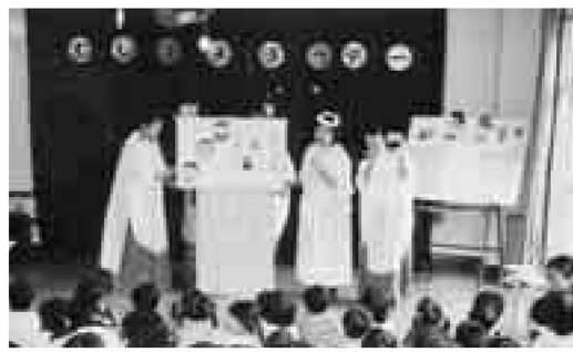
▲歯の衛生週間に合わせ、歯の大切さを学んでいる子どもたち

員=各日48人(当日先着順) ※会場での貴重品の管理は、各自でお願いします。 申込=当日直接会場へ 問先=障害福祉計画係 ☎(3880)5255