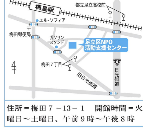
住所=梅田7-13-1 開館時間=火曜日~土曜日、午前9時~午後8時 ※地図は簡略図です

▷講座・セミナー…NPO基礎講座、法人設立講座、マネジメント講座などを定期的に行っています。 ▷相談事業…NPO専門員、NPO実践者、専門相談員(税理士、行政書士、社会保険労務士、中小企業診断士)による相談を随時行っています。 ▷会議室の利用…会議や研修会などを行う場所を提供します。NPO活動で利用する場合は使用料が減免されます。 ▷印刷室の利用…原紙代のみで輪転機を使用できます。丁合機、紙折機は無料です。 ▷交流スペース…会員同士のミーティングや作業場として自由に利用