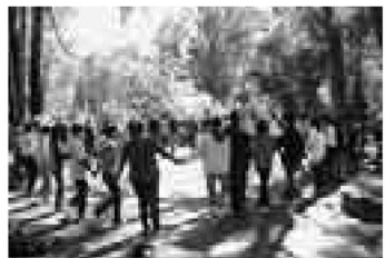
▲自然の中で交流のひとつ

日程=8月16日~23日(7泊8日) 場所=ベルモント市内 対象=>一般枠...観光交流協会会員(小学生までは保護者同伴) >学生枠...区内在住の中学生・高校生(観光交流協会の会員家族優先) 内容=オーストラリアの美しい町並みや文化に触れ、ベルモント市と交流を図る 定員=>一般枠...20人 >学生枠...10人程度 ※いずれも抽選 費用=>一般枠...218,800円(空港税など別途負担。子ども料金同額。全ホテル泊、ホームステイも可) >学生枠...168,800円(全ホームステイ) 申込=>一般枠...ハガキに住所、氏名、年齢、連絡先、同行の家族(同