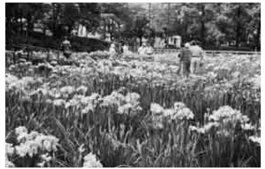
初夏の訪れを告げるハナショウブ