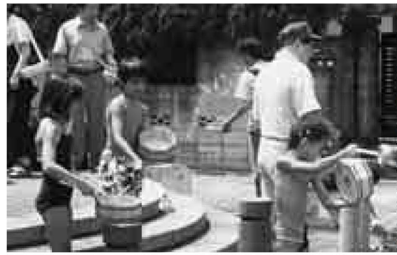
▲打ち水で地球温暖化の防止を図る取り組みを行うNPOもあります

7年に起きた、阪神・淡路大震災の被災者救援活動をきっかけに、注目されるようになったNPO。今や行政でも企業でもない、もうひとつの公共サービスの担い手として期待されています。区では、こうしたNPO活動を支援すると共に、協働のパートナーとして一緒に地域課題の解決を図ってまいります。