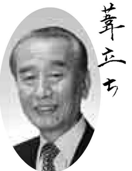
「うれしい話と心温まる話」

美遊展 「輝け未来の文化」 日程等II表2 内容II守り、受け継がれている伝統文化に触れられる、足立区文化団体連合会加盟団体の合同展示会 申込II当日直接会場へ