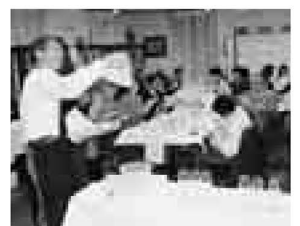
あなたも今日からワイン通

日時=7月7日(金)、午後6時30分~8時 場所=ベルモント公園 対象=観光交流協会会員と区民 内容=姉妹都市ベルモント市があるオーストラリアのワインを、ソムリエの話聞きながら楽しむ 定員=30人(抽選) 費用=>会員...1,500円 >一般...2,500円 申込=往復ハガキの往信表に希望者全員の住所、氏名、年齢、電話番号、会員・一般の別、「ワインの夕べ希望」を明記 ※ハガキ1枚で4人まで申し込み可。重複申し込みは無効。返信表に代表者の氏名、住所を必ず記入 期限=6月2日必着