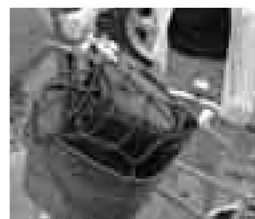
▲防止ネットは、ひった くりだけでなく、荷物 の落下も防ぎます