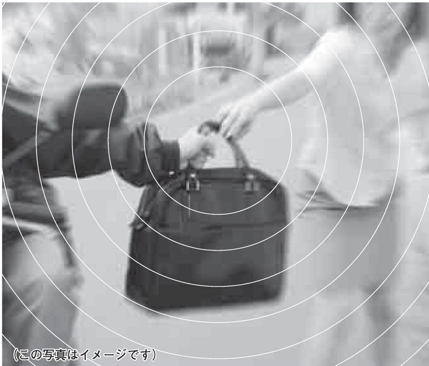
(この写真はイメージです)