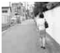
▲この歩き方なら、カ バンを持つ側をバイ クは通れません

ひったくり犯罪の特徴 18年に入り、区内でのひ ったくり発生件数は、6月末現在108 件で、昨年の同時期に比べて49 件も増加しています。 17年の統計から、都内のひ ったくり犯罪には、次のような特 徴があることがわかりました。 皆さんも、注意してください。 ▽犯罪が発生する時間帯は、午 後8時から午後10時ごろまで が、全体の約2割 ▽被害者の9割以上は女性 ▽自転車の前かごに入れたバッ グや、歩いている人が持って いるバッグなどを、追い越し ざまにひったくるケースが多 い