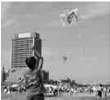
▲大空高く、舞い上がれ