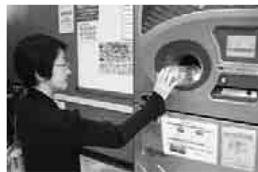
▲ボイ捨てせずに、リサイクル

「中を洗い、キャップとラベルを外して、入れるだけ」がモットー。区民の皆さんが、資源回収・リサイクルに参加しやすい仕組みとして、区は7月から、企業と協働し、区内スーパーマーケットの店頭にはペットボトル自動回収機を設置しました(表2)。ペットボトルは投入後、自動的に選別・分別・破砕されるので、自分でつぶす必要はありません。