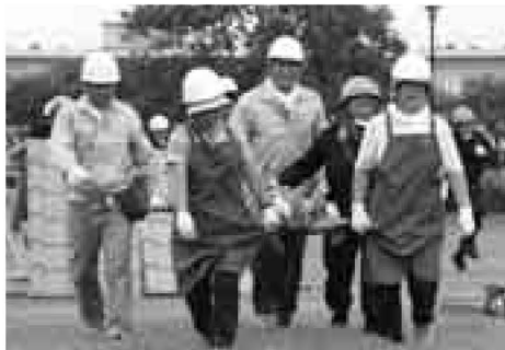
▲担架でケガ人運ぶ区民参加訓練(17年足立区)

訓練会場周辺では、道路を使用した訓練などのため、交通・通行規制を行います(くわしくは4面を参照)。また、ヘリコプター発着の際の吹き降ろしの風、飛来音やサイレンなどによりご迷惑をおかけしますが、ご理解・ご協力をお願いします。