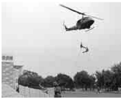
▲ヘリコプターでの訓練(17年足立区)

都内の広い範囲で被害が起こった場合の応援体制の強化や都市特有の災害時対応を含め、次のような訓練を行います。 ▽都境を越えた救援物資の輸送・避難誘導