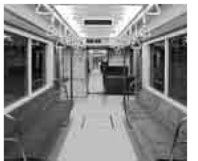
▲ロングシートの色は、濃いブルー

10月17日に、都立舎人公園内 に建設中の車両基地へ車両が搬 入されました。搬入は来年まで 続きます。