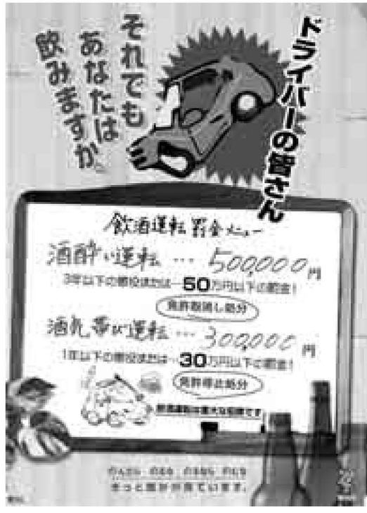
▲警視庁の飲酒運転減発啓発ポスター

お酒を飲む機会が多くなる年末年始。車を運転するときは、絶対にお酒を飲んではいけません。