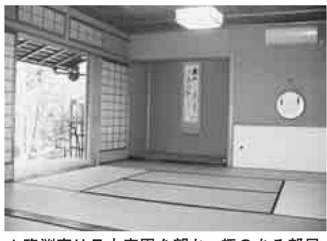
▲臨淵亭は日本庭園を望む、趣のある部屋

臨淵亭は、郷土博物館に併設している東湖庭園(回遊式日本庭園)内にある和風集会所で