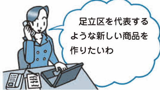
図2 あだち提案型事業のコース