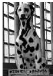
せんきょけん「エラビ」も投票を呼びかけ

選挙日程などに関するお問い合わせは、選挙管理委員会事務局へ ☎3880-5581