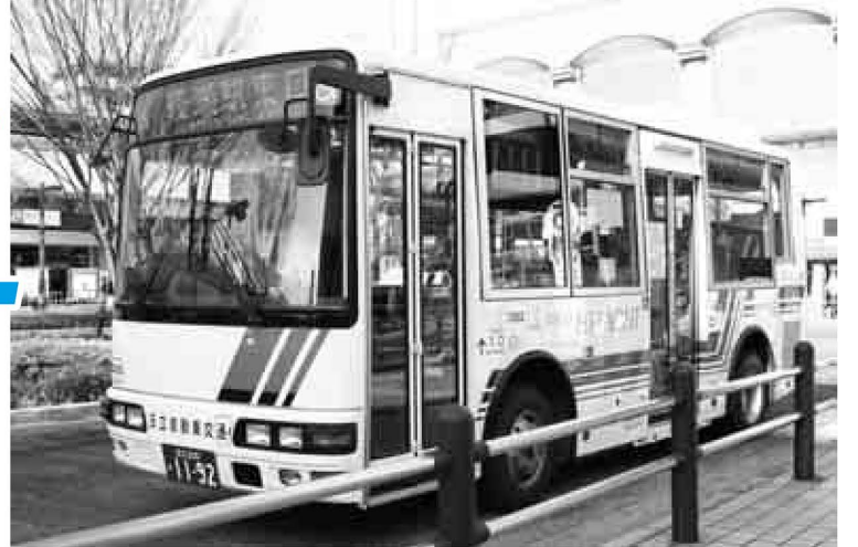
▲新路線と同型の車両(写真は第9弾)

「はるかぜ」は、区が走行のための環境整備を行い、バス事業者が独自に運行しているコミュニティバスです。12年4月に第1弾(西新井駅東口～綾瀬駅東口間)が運行を開始して以来路線を増やし、現在では9路線になりました。さらに第10弾として、4月14日(土)午後から、新たな路線の運行を予定しています。今号では、皆さんから問い合わせが多い「はるかぜ」に関する事柄などを1面で、「はるかぜ」の区内路線概略図、第10弾の運行ルート図および、日暮里・舎人ライナーについてを8面でお知らせします。