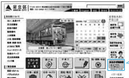
図1 足立区公式ホームページ画面

答4 …区のホームページで全路線、全バス停の時刻表を見ることができます(図1)。また、路線ごとの資料(A4判、料金や一部バス停の時刻表などを掲載)を、区役所1階総合案内と2階の区政情報室(4月からは区政相談課)で配付しています。