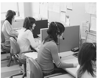
▲自動電話催告システムを使って、徴収強化に取り組んでいます。

特別区税41億円は、区民の皆さんにとって住み良いまちをつくるために、福祉や教育などをはじめ、様々な行政サービスに充てられます。区では、この財源を確保すると共に、納税した方との公平性を保つため、滞納している方に対し、区税の徴収強化に努めています。