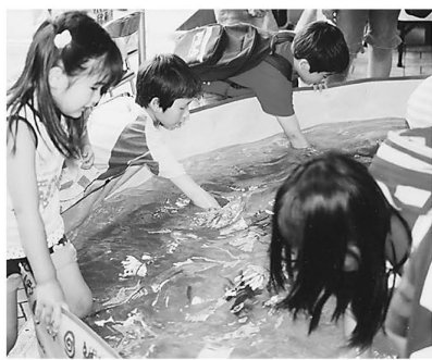
▲みんなで仲良く魚にタッチ!

各事業の申し込み・問い合わせ先は ▷太陽光発電・小型雨水貯留タンク設置費用補助…環境計画係 ☎3880-5935 ▷環境保全団体活動費用助成…環境推進課事業推進係 ☎3880-5631