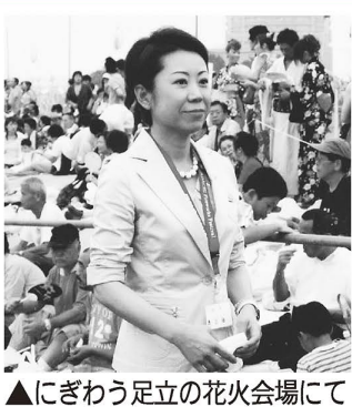
▲にぎわう足立の花火会場にて

区の最大イベントである花火大会。翌日、会場にうずたかく積み上がったゴミの山また山。開会のあいさつの中で、「翌日、小学生や高校生などがボランティア清掃をします。子どもたちをがっかりさせないよう、ゴミの持ち帰りなど、大人のマナーを示してください」とお願いしたのですが、効果はなかったようです。翌日の「区民の声」にも、会場内外の目に余る行為について多数お怒りのご意見が寄せられました。また、直前の大雨で火薬が湿り、安全確認のため約30分の中断があり、ご迷惑をお掛けしました。こうした対応も含めて、課題を整理検討し、来年の30回大会に臨みたいと思います。◆新潟県中越沖地震に対して「区としてできる限りの援助をしてあげてください」とのご意見もたくさんいただきました。発生3日後には、粉ミルクや紙おむつなど、先方から依頼のあった物資を手に6人の危機管理室職員が現地入り。続いて、建築担当部の応急危険度判定士1人と衛生部の女性保健師2人も現地入り。区の代表としてがんばってくれました。◆区は20万人が3食食べられるだけの食料や水、生活必需品などを備蓄していますが、それぞれのご家庭の準備はいかがですか? 防災訓練に合わせて、もう一度ご確認ください。