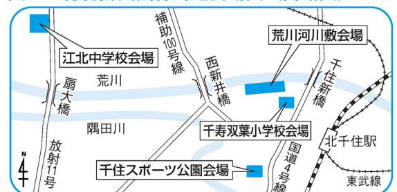
図1 総合防災訓練周辺会場図(簡略図)