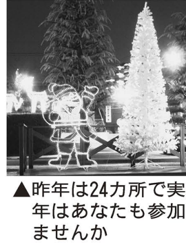
▲昨年は24カ所を実施。今年にはあなたも参加してませんか

対象=子どもと家庭の問題にかかわる相談対応などの経験者 勤務内容=18歳までの子どもと家庭に関する相談対応と援助ほか 勤務条件=週4日勤務(30時間) ※有給休暇、社会保険あり 雇用期間=12月1日~20年3月31日 ※更新可 報酬=月額21万円(税込み) 募集人数=1人 選考=書類審査および面接 申し込み方法=履歴書(写真貼付)、作文「応募の動機とあなたの活かしたい能力や経験など」(800字程度)、所持する資格の免許証の写しを郵送または持参 ※申込書類は返却不可 期限=11月10日(日)必着 面接日時=11月15日(日)、午前9時 申し込み・問い合わせ先=こども家庭支援センター 〒120-0004東綾瀬1-5-17 ☎3606-1333