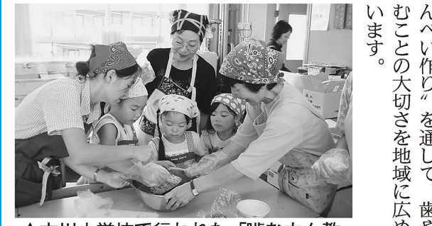
▲中川小学校で行われた「噛むカム教室」の様子