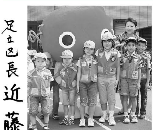
▲千住エキゾチックフェ アで子どもたちと区長 とマスコットのじゅじゅ

教育委員会で行いました内部調査では、配布した問題 は、厳重に保管され、漏洩もなかったことが明らかにな りましたが、広く区民の皆様にご心配をお掛けしたこ とを深くお詫びいたします。