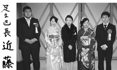
▲成人代表の方たちと 区長(中央)

区役所での申告相談会や、インターネットを利用した お得な申告方法を8面に掲載しています →→→