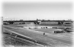
昔からの区民の憩いの場「荒川」