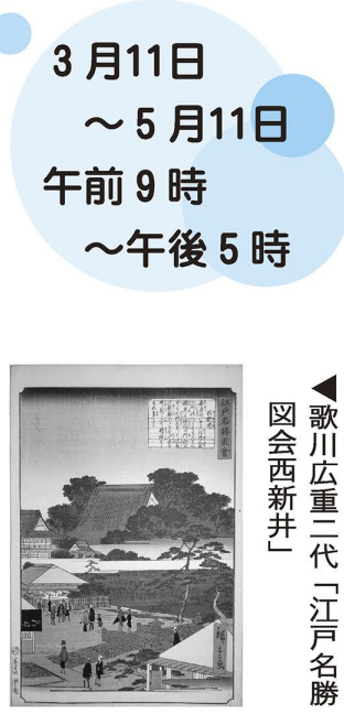
▲歌川広重二代「江戸名勝 図会西新井」

休館日＝毎週月曜日(祝日の場合はその翌日) 費用＝▷大人(高校生以上)…200円 ▷団体(20人以上)…100円 ※中学生以下、70歳以上で区内在住・在勤・在学の方、障害者手帳を持っている方とその介護者1人までは無料。毎月第2・3土曜日は無料公開日 問い合わせ先＝郷土博物館 ☎3620-9393