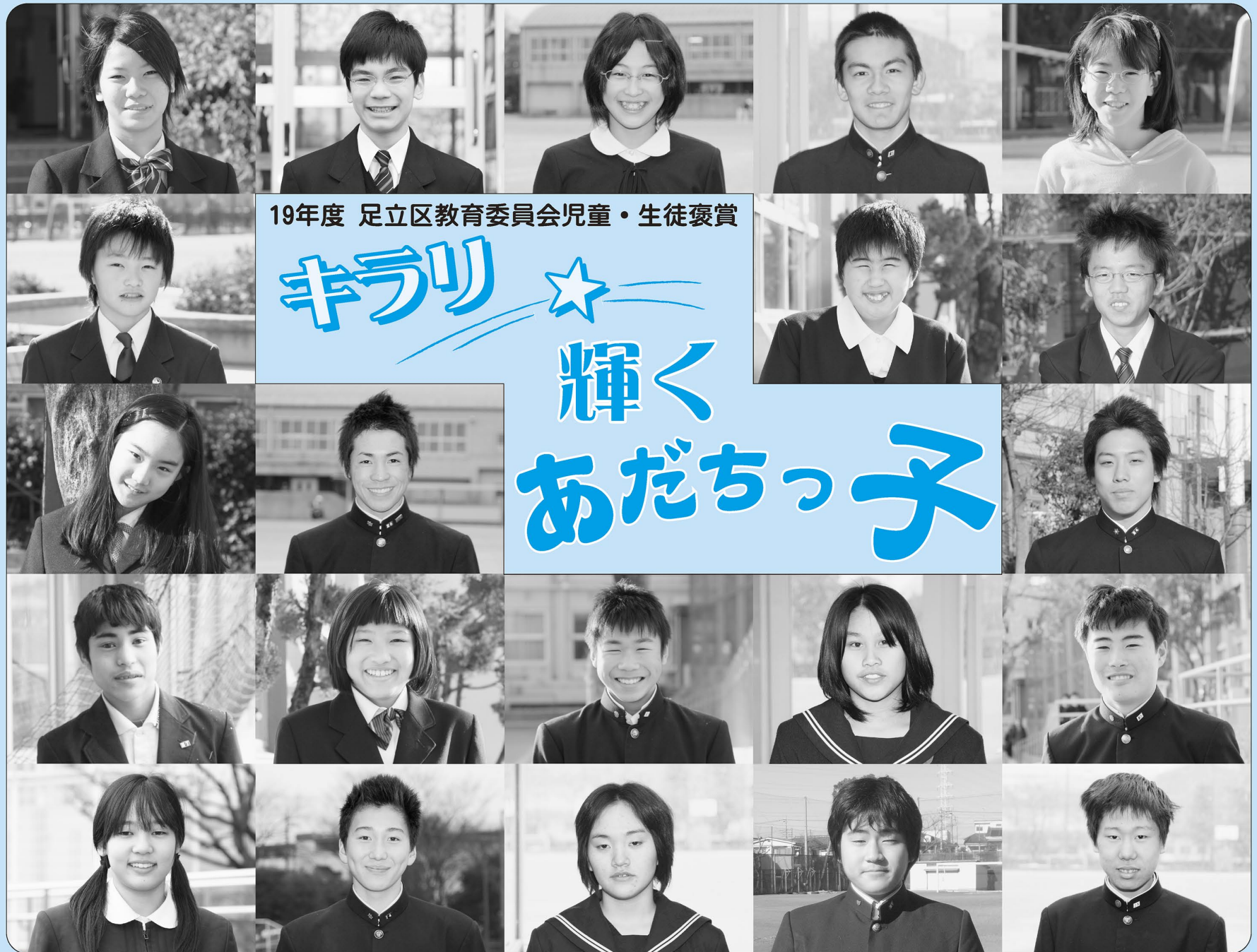
19年度 足立区教育委員会児童・生徒褒賞