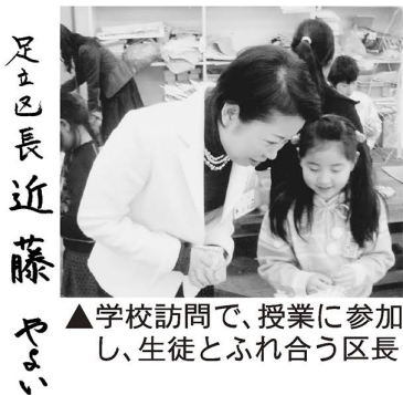
▲学校訪問で、授業に参加し、生徒とふれ合う区長

《文化・団体》 ◆吹奏楽 第十一中学校吹奏楽部 ◆新聞 栗原北小学校新聞委員会 第九中学校2年6組 《スポーツ・団体》 ◆陸上 足立区選抜男子リレーチーム 栗島中学校5組男子リレーチーム