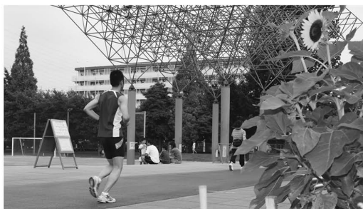
▲ウォーキング・ジョギングコース。めざせ100周フルマラソン

◆多目的広場(屋外施設) 広い敷地を利用して、サッカーなどが行えます。また、照明も完備されているので、午後9時まで利用できます。さらに、そのグラウンドを囲むように整備されているのが、ウォーキング・ジョギングコース。1周が約421・95m