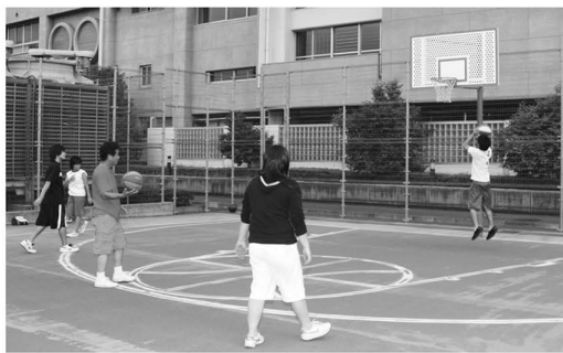
▲区内でも珍しい3on3コート

◆多目的広場(屋外施設) 広い敷地を利用して、サッカーなどが行えます。また、照明も完備されているので、午後9時まで利用できます。さらに、そのグラウンドを囲むように整備されているのが、ウォーキング・ジョギングコース。1周が約421・95m