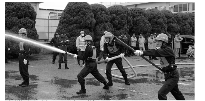
▲消防操法の訓練の様子