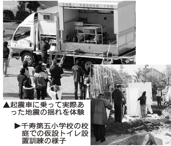
▲起震車に乗って実際あった地震の揺れを体験

各家庭で避難する避難所を、区のホームページや全戸配布されている防災マップなどで確認しましょう。あわせて、自宅などから避難所まで安全に避難するための経路を日ごろから確認しておきましょう。また、町会・自治会ごとに、集団で避難するための一時集合場所(公園や神社など)が指定されています。一時集合場所も区のホームページなどで確認してください。