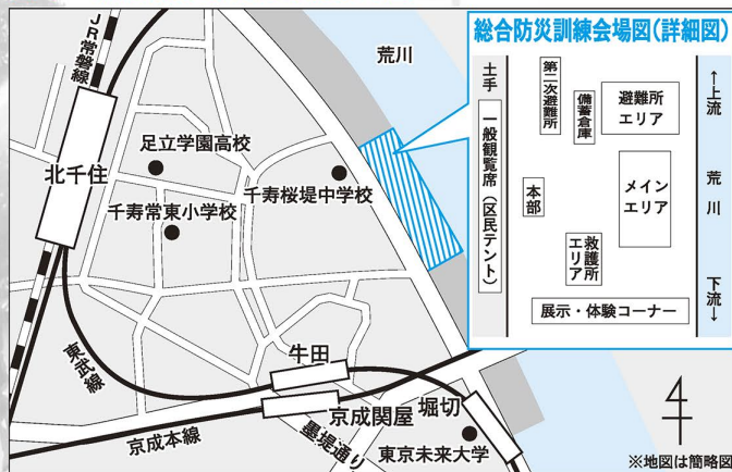
図1 総合防災訓練会場案内図

※北千住駅東口から徒歩約15分、堀切駅から徒歩約8分 ※車でのご来場はご遠慮ください