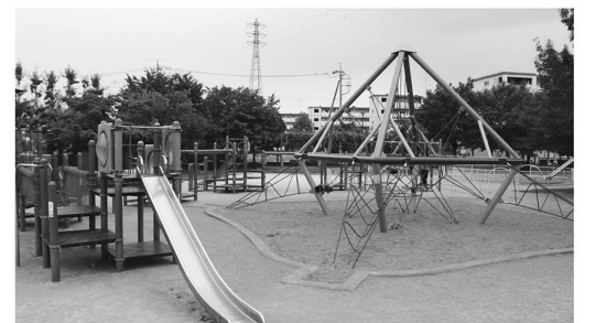
▲ジャングルジムなどがある公園も併設されています

◆柔道場/剣道場 柔らかい畳が敷き詰められた柔道場と、2面の試合場がある剣道場。道着や防具を身に付けて、裸足で足を踏み入れた瞬間に身も心も引き締まります。