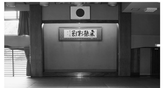
▲「柔よく剛を制す」の書がある柔道場

◆アスレチックルーム 登録制で、ランニングマシンなどを利用した有酸素運動や、ウエイトマシンなどを利用した筋力トレーニングができます。ここでは、自分に合ったトレーニングメニューを、インストラクターと一緒に作成します。