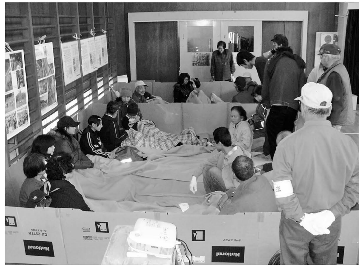
▲体育館で避難生活を送る場合の状況を実際に体験(避難所運営訓練の一部)

※荒天などにより中止になることがあります ※訓練の予定が変更になることがあります。 最新の訓練予定および詳しい訓練の開始時間などについては、区のホームページをご覧ください