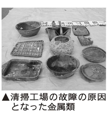
▲清掃工場の故障の原因となった金属類

ごみの出し方を守りましょう 液晶・プラズマテレビ、衣類乾燥機は家電リサイクルへ 家電リサイクル法の改正により、液晶・プラズマテレビ、衣類乾燥機が、4月1日から対象に追加されます(表1)。 1. 家電リサイクル法の対象製品が不要になった場合は、「粗大ごみ」として出すのではなく、次の方法で廃棄してください。 ◆廃棄方法 家電リサイクル法の対象機器を廃棄する方法は、①購入店に引き取りを依頼する、②家電リサイクルセンターに収集を依頼する、③指定の引取場所(直接持ち込む(製造業者により場所が異なる))、の3つがあります。また、①②はリサイクル料金と運搬料金が掛かります。③はリサイクル料金のみです。なお、区では収集を行っています。 リサイクル料金=冷蔵庫・冷凍庫170円以下:3千780円、171円以上:4千830円/エアコン 21年度版「資源とごみの分け方・出し方」を配布 「燃やすごみ」の中にフライパン・なべ・やかん・針金ハンガーなどの金属類が混ざっていると、清掃工場が故障し、ごみが燃やせなくなり、工場が故障すると、多額の修理費用が掛かるだけでなく、ごみが搬入できなくなり、皆さんに多大な影響を与えます。金属類は「燃やさないごみ」の日(隔週1回)に出してください。 — ぐずれも — 問先=清掃計画係 ☎(3880) 5813 足立東清掃事務所(千住地区) および国道4号線から東側 ☎(3880) 0711 足立西清掃事務所(千住地区)を除く国道4号線から西側 ☎(3880) 2141 足立清掃工場 ☎(3880) 4475