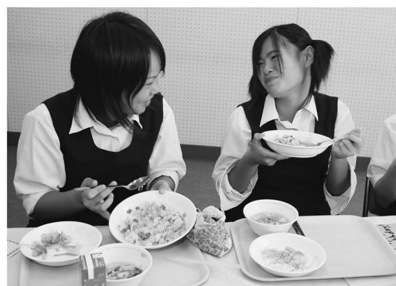
▲子どもたちが食の大切さを知り、残さず食べられるように、「おいしい給食日本一!」をめざします

一流料理人にオリジナルメニューの作成を依頼し、栄養士や調理員の調理技術の向上を図ります。また、おいしい給食推進委員会の方針をもとに、子どもの健康づくりのため、子どもが喜ぶ給食を推進します。