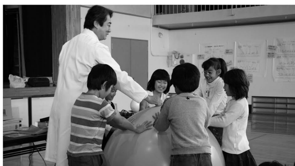
▲みんなで楽しく体験しながら理科を学びます

ちサマースクール(小学生の夏季補助教室)で補習を行い、子どもの基礎学力を定着させます。また、理科実験や伝統文化に触れる体験の場を作り、学びの喜びや学習意欲を高め、人間性豊かな子どもを育みます。