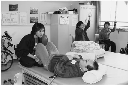
▲筋力トレーニングなど、一人ひとりの能力に合った運動訓練を行います