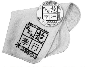
▲花めぐり手形。購入者にはミニタオルをプレゼント