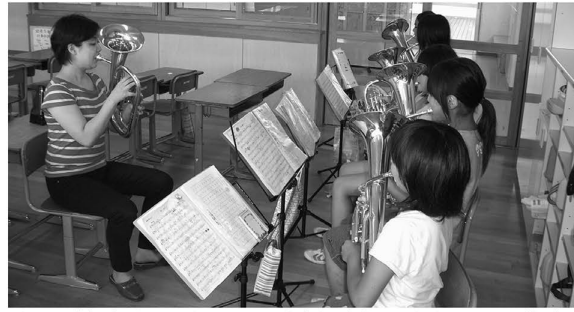
▲大学生と地域の子どもが交流し、芸術活動などに積極的に取り組みます

放送大学・東京藝術大学・東京未来大学に加え帝京科学大学(22年度開学)・東京電機大学(24年度開学)と、千住地域に5つの大学がそろそろ予定です。各大学の特色を活かしながら、産業・大学・区が連携して経済や文化の交流を図り、区のイメージアップと活力あるまちづくりを進めます。