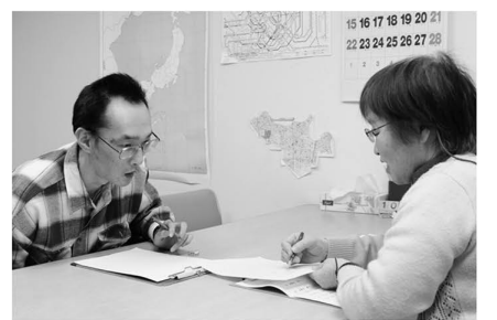
▲会話や書き取りの訓練も行います

現在利用している方の中には「初めて自力で歩いた光景は今でも忘れられません。光が差して輝いているようで」と語りました。仲間とのつながりを作る