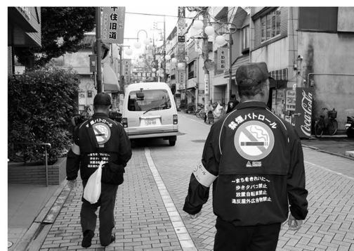
▲パトロールを進め、迷惑喫煙防止を進めます

北千住駅周辺に続き、10月から綾瀬駅周辺を「禁煙特定区域」に指定し、迷惑喫煙防止を強化します(喫煙した場合、過料1,000円を適用)。また、美化推進キャンペーンや迷惑喫煙防止パトロールなどを行い、より快適できれいなまちをめざします。