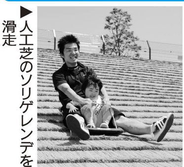
▶人工芝のソリゲレンデを滑走

対象＝小学生以下の子ども(未就学児は保護者同伴) 定員＝各120人(先着順) 問い合わせ先＝(財)東京都公園協会事業企画チーム ☎3232-3015