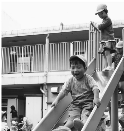
▲保育サービスを充実し、子どもの笑顔を守ります

実した保育サービスを受けられるように、認証保育所などの利用者助成の増額、家庭福祉員の保育料の値下げを行います。また、学童保育では民間学童保育室を増設し、待機児童について夏休みなどに児童館での受け入れをします。