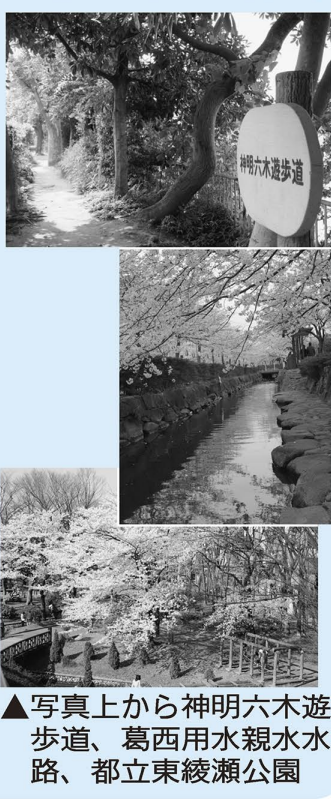
▲写真上から神明六木遊歩道、葛西用水親水水路、都立東綾瀬公園

この下は広告スペースです。内容については各広告主にお問い合わせください。広告掲載のお問い合わせは、広報課へ ☎3880-5815