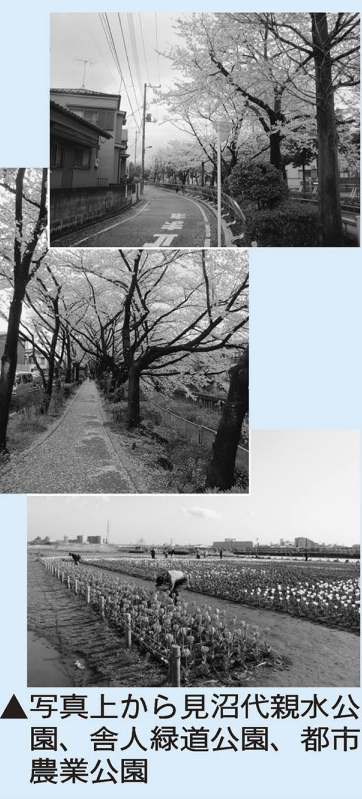
▲写真上から見沼代親水公園、舎人緑道公園、都市農業公園