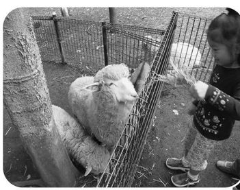
◀生物園の動物たちが出張

② 生物園出張ふれあい動物コーナー 午前10時～午後3時 ミニチュアポニーやヒツジ、ヤギといった動物たちと触れ合うことができます。 ※エサやりのエサ代は有料 問い合わせ先＝区・生物園 ☎3884-5577