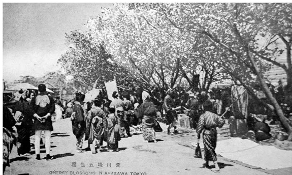
▲かつて桜の名所だった荒川土手の大正から昭和初期の様子。この桜の復活をめざします

堀(江北二・三丁目)に桜を植樹し、新たな桜の名所とするため、皆さんから寄附を募ります。「オーナー」となった方は桜に銘板を付けられます。