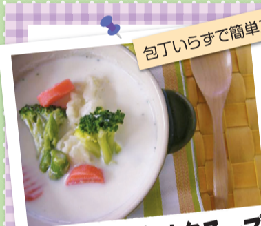
冷凍野菜のミルクスープ (141kcal)