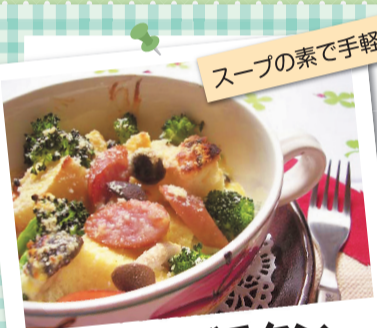
簡単パングラタン (305kcal)