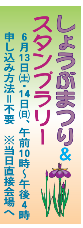
色鮮やかなしょうぶが見る人の目を楽ませます(昨年の様子)

問い合わせ先=しょうぶ沼公園での催し:公園整備課公園活用係 ☎(3880)5897 / シャンターボランティア/ハト公園での催し/スタンプラリー:観光交流協会(観光交流課内) ☎(3880)5893