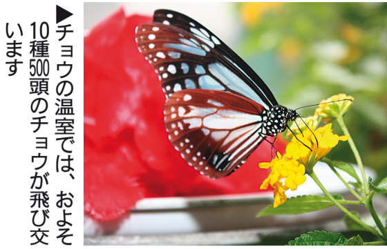
▶チョウの温室では、およそ10種類500頭のチョウが飛び交います