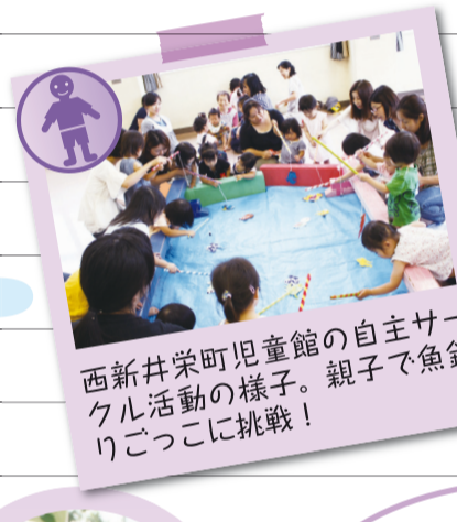
西新井栄町児童館の自主サークル活動の様子。親子で魚釣りごっこに挑戦!

子育てサロン梅島が5月にオープンしたことをあだち広報で知り、利用始めました。今は週に2度くらい来ています。特に雨の日は、公園に行く代わりに利用できるので、助かります。子育ての悩みや情報をお互いに話し合えるママ友達が、たくさん増えました。