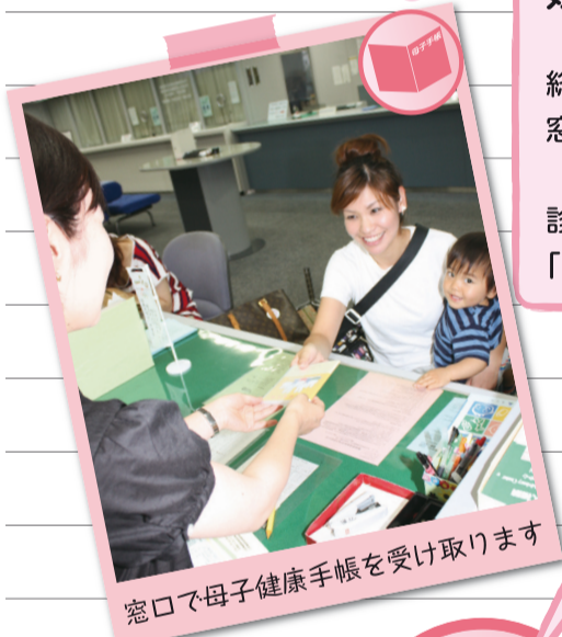
窓口で母子健康手帳を受け取ります

妊娠届 妊娠が分かたら、区民事務所、保健総合センター、健康推進課健康推進係の窓口に行って、妊娠の届出をしましょう。母子健康手帳と一緒に、妊婦健診の受診票やマタニティキーホルダーの入った「母と子の保健バッグ」を差し上げます。