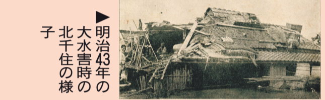
▶明治43年の大水害時の様子