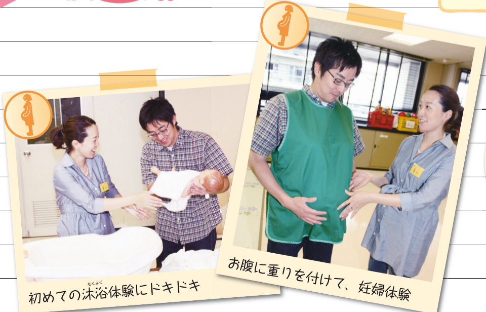
初めての沐浴体験にドキドキ