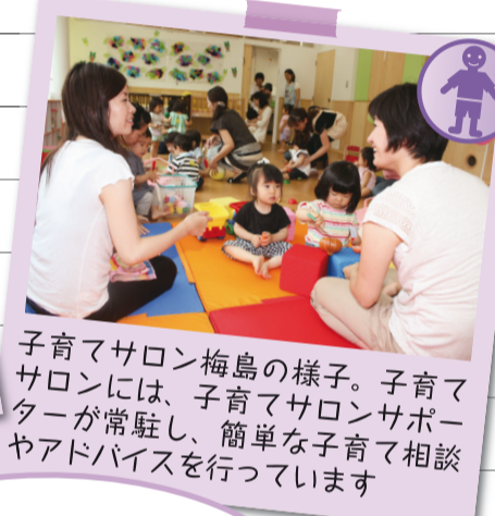
子育てサロン梅島の様子。子育てサロンには、子育てサロンサポーターが常駐し、簡単な子育て相談やアドバイスを行っています