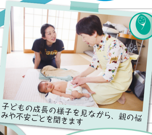
子どもの成長の様子を見ながら、親の悩みや不安ごとを聞きます

子どもの体重がなかなか増えずとても心配でした。そんな中、保健師さんに「ちゃんと増えていますよ」と言ってもらい、とても安心しました。子どもが小さく、外出しづらいので、自宅まで訪問してくれるのはとても助かり、精神的な支えになりましたね。