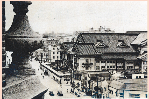
▲東京名所絵はがき「歌舞伎座」(昭和7年)

今回の企画展では、明治時代から昭和初期までに発行された古い絵はがきを展示します。現在では見られない貴重な建物や出来事を知ることができます。