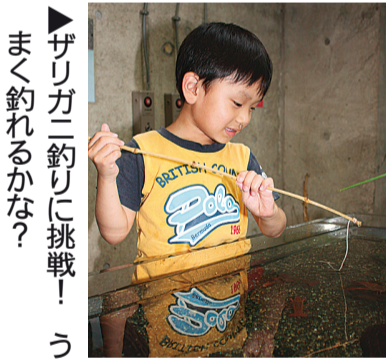
▶ザリガニ釣りに挑戦! うまく釣れるかな?

ている休憩スペースでは、飲食もできるようになっています。入園料▽高校生以上300円▽小学生未満・70歳以上:無料 ※毎月第3土曜日と10月1日は区民無料 問い合わせ先||生物園 ☎(3884)5577