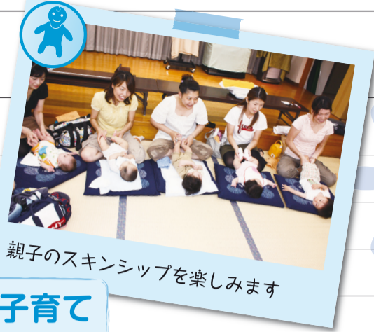
親子のスキンシップを楽しみます

交換しよう、子育て情報 赤ちゃんひろば 保健総合センターや児童館では、1歳未満の親子が集まり、親同士の情報交換や仲間作りの場を提供しています。