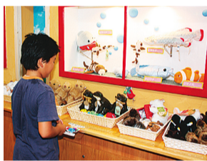
▲ミュージアムショップには、生物園ならではのグッズがいっぱい

4月には館内にミュージアムショップもオープンし、生物園にちなんだぬいぐるみや生き物観察グッズなどを販売しています。また、併設され