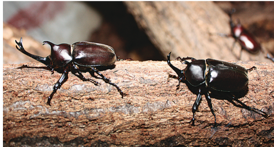
▲人気のカブトムシにも触れ合えます

様々な種類の生き物たちと触れ合える生物園。チョウの温室では、オオゴマダラやリュウキュウアサギマダラなどの色鮮やかなチョウが、熱帯の木々の間を優雅に舞っています。多自然型の庭園では、モルモットやウサギなどの小動物を抱いたり、ヤギやヒツジなどに餌をやりたりすることができます。そのほか、生物園ガイドツアー、昆虫標本作り、セミの羽化観察会、生物園ナイトツ