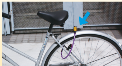
▲自転車にはワイヤー錠など2つ目のカギを付ける