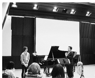
▲世界に誇れるスタジオを利用し、催しなどを

の年齢層、フロアの商品構成などを考慮した音響デザインを提供しました。中には、洋服を販売しているフロアで、