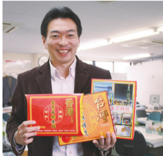
▲アジア観光施設へのお土産の企画・販売で受賞

区内に大学も増えますし、学生向けのビジネスチャンスなどを狙って挑戦してはいかがですか?