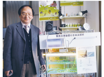
▲緊急災害装置付き未来照明機器で採択

新しいことにチャレンジする区内の事業者が増え、区内産業全体が活性化すればいいなと思っています。応募を考えている方がいれば、わたしもいつでも相談に乗り、応援しますよ。