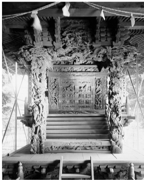
細やかで美しい彫刻が施された本殿。普段はなかなか見ることのできない足立区登録有形文化財です

区では、区内の小学校に「キッズISOプログラム初級編」への取り組みを呼び掛け、環境教育を進めています。 問先=温暖化対策課事業推進係 ☎3880-5860