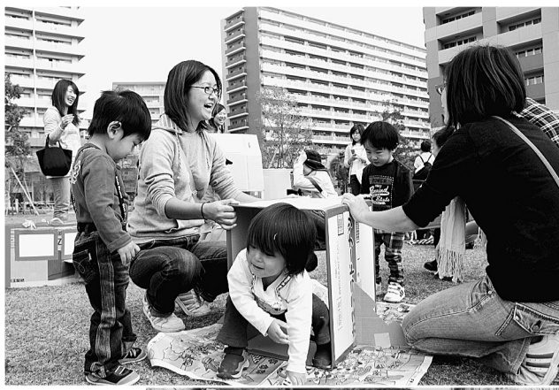
▲大盛況のちっちゃなまち。元気に遊ぶ親子たちであふれました

昨年10月のある秋晴れの日。西新井さかえ公園に、「ちっちゃなまち」が出現しました。ダンボールでできたお店屋さんや電車などが並び、これまでの公園にはなかった目新しい遊び道具に目を輝かせた子どもたちの大きな歓声があがりました。これは、子育て世代の方々のアイデアから生まれたものです。「安全・安心で快適な公園