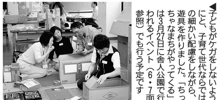
子どもがケガをしないようにと、子育て世代ならではの細かい配慮をしながら、遊具を作りました。「ちっちゃなまちがやってくる」は3月27日に舎人公園で行われるイベント(6・7面参照)でも行う予定です

今回の「ちっちゃなまち」の試みは、今後の活動を考える実践活動の1コマに過ぎません。約9カ月にわたる「パークエンジェル」育成講座は2月に修了し、8人に修了証が授与されました。今後はこの8人が、定期的に西新井さかえ公園でのイベントや、自宅近くの公園の見守りを行っていく予定です。