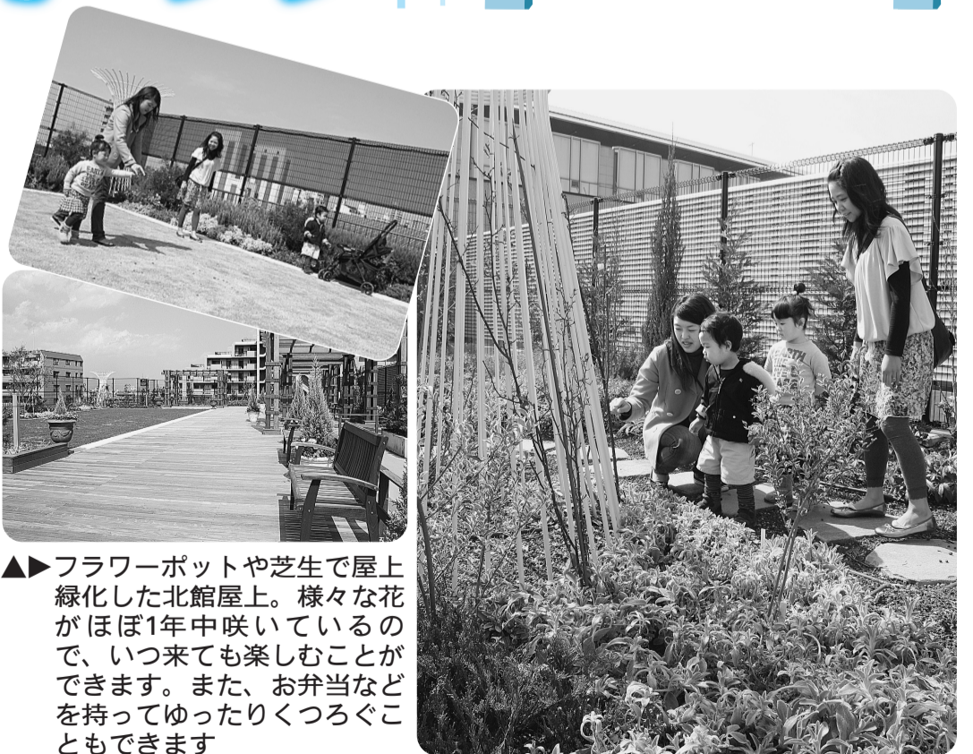
▶▶ フラワーポットや芝生で屋上緑化した北館屋上。様々な花がほぼ1年中咲いているので、いつ来ても楽しむことができます。また、お弁当などを持ってゆったりくつろぐこともできます

内容=午前10時の式典終了後と午後2時に「花の苗」をプレゼント。当日1人につき1苗。先着各250人 ※「花の種」は随時配布。なくなり次第終了