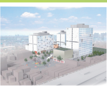
▲北千住駅東口の新キャンパスは現在建設中。地域に開かれた3つの広場ができる予定です

生命環境学、医療科学、こども学などの専門分野を学ぶ大学のため、作業療法士や保育士など、将来の目標を明確に定めている学生が多いです。そうした意欲に対し、強い目的意識のもとで物事をしっかり考え、コミュニケーション能力を発揮できる人間の育成に力を入れています。わが校は「地域貢献」にも力を入れています。現在、既にある山梨県上野原キャンパスでは、障がいのある方のための乗馬会を開催したり、保育園や小学校での実習を行ったり、様々な形で地域貢献を行っています。千住キャンパスでも、下町の人情あふれる地域の方々と協力し合って、互いのためになるような地域貢献をめざしていきたいです。