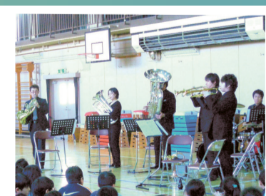
▲区内の小・中学校へも活発に訪問し、鑑賞会や音楽指導を行っています

東京未来大学 区が力を入れている「早寝・早起き・朝ごはん」事業を連携して進めています。昨年6月の食育イベントでは、食育ソングの普及に学生が役を買ってくれました。また、10月に行われた東京未来大学の学園祭では、区の食育ブースの出展に協力し、様々な世代に食育を広めてくれました。