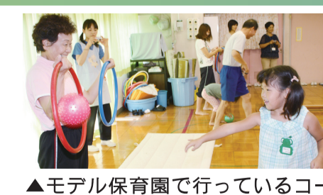
▲モデル保育園で行っているコーディネーショントレーニング(体・脳・筋肉をバランスよく発達させ、運動効果を高める運動)で指導をお願いしています

東京電機大学東千住キャンパス 24年の開設を前に、様々な連携イベントが始まっています。昨年8月には東京電機大学などが主催した「IDCロボコン国際交流大会」をシアター1010で行い、区内の子どもたちが世界の技術を目的にしました。同年9月には、区が主催する「足立区町工場見学会」に大学職員や学生が参加したり、今年1月には産学連携交流会を開催したりと、足立区の産業界との交流を深めています。そして、1月下旬の区内小学生を対象とした「あだち子どもづくりフェスタ」では、体験コーナーを設置するなど、教育分野での連携も始まっています。