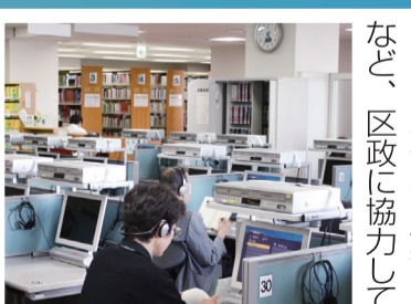
▲図書室・視聴室は区民の方にも開放しています

東京藝術大学千住キャンパス 施設もスタッフも一流の東京藝術大学。本格的な音楽に触れることができるサロンのコンサートやおとそびの親子教室は大人気です。毎回定員の親子教室は3倍の応募があります。一流の音楽文化に触れる講座やアートマネジメントの講座なども行い、区の文化芸術の普及に努めています。