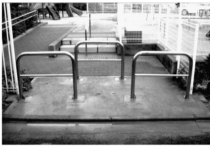
▲八千代児童遊園に設置した柵

方法＝区のホームページまたは広聴ハガキ、電話、ファクス、Eメールで意見・要望を連絡 ※広聴ハガキは区の施設で配布 — いずれも — 申・問先＝区民の声担当 ☎3880-5839 ☎3880-5678 ✉voice@city.adachi.tokyo.jp