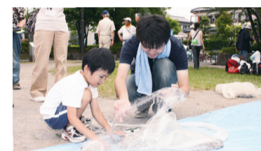
▲昨年7月に行われた「堀川調査隊」。子どもたちに自然との触れ合う楽しさを伝えてくれました

北千住駅西口商店街が主体となって、662本の開学歓迎フラッグ(旗)を掲示するなど、まちの歓迎ムードが高まっています。フラッグは東京藝術大学の学生がデザインしました。