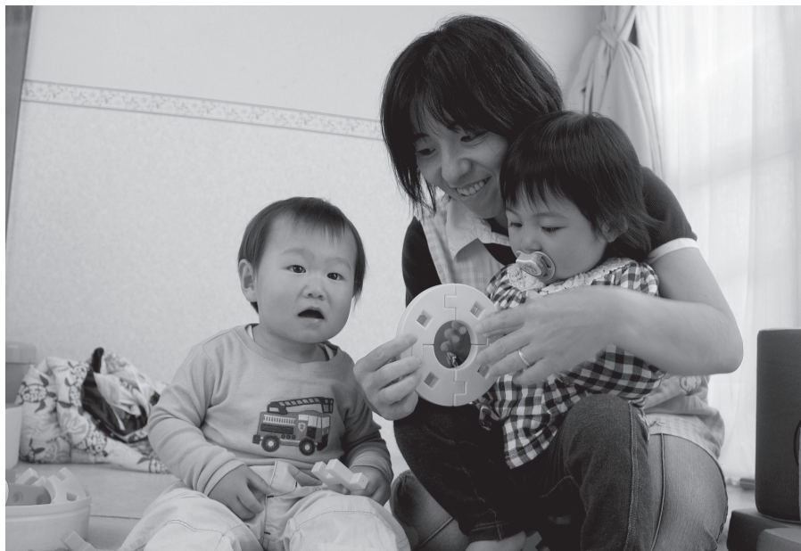
▲子ども一人ひとりとじっくり触れ合えるのもこの仕事の魅力

楽しみがいっぱいの家庭福祉員だが、とても責任の重い仕事だということも確かだ。「やはり、命を預かっているという点で緊張しますね」。急に熱を出したりけがをしたりと、その場での適切な判断が求められることも少なくない。「屋外などで遊んでいる途中、ほんの小さなけがをしてしまう場合もあります。『このけがなら大丈夫』と判断しても、状況など細かい部分までしっかりと保護者に報告します」