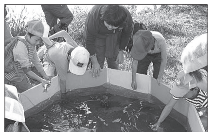
▲(上)荒川での魚類調査の様子 / (下)堀川で捕れた魚を観察している様子

◆電話番号は、よく確認してから掛けてください 各施設と間違えられて電話が掛かり、迷惑をしている区民の方がいます。電話番号をよく確認の上、掛けてください。また、必ず相手を確認してから用件を話してください。