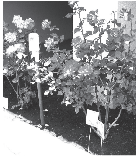
▲あなたの自慢の花と緑をご応募ください

募集期間=6月10日~8月31日(消印有効) 対象=花と緑にあふれた美しいまちづくりに取り組んでいる区民の方 ※自薦・他薦は問わず 内容=誰もが自由に眺めることができる庭や店先で、美しい花壇や生け垣、植え込みおよび壁面緑化を行っている方を表彰 募集部門=花壇(植え込み)の部/生垣の部/緑のカーテンの部 申込=応募用紙を☑へ郵送、持参またはEメール(携帯メール含む)で送信 ※応募用紙はみどり推進課公共緑化担当で配布するほか、区のホームページからもダウンロード可 ▲あなたの自慢の花と緑をご応募ください