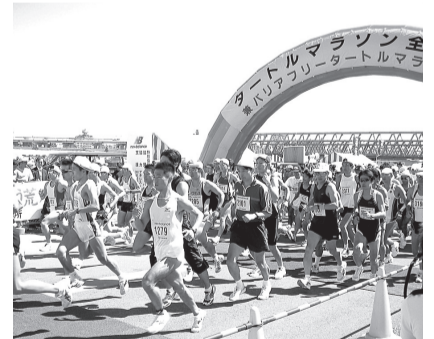
▲完走をめざす参加者を笑顔でサポートしませんか

都市農業公園の催し ◆田んぼ探検隊「田んぼの水草で寄せ植えづくり」 日時 6月20日(日)、午後1時