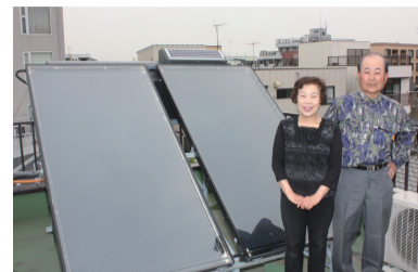
▲「設置費用は50万円程度でした」とにっこり