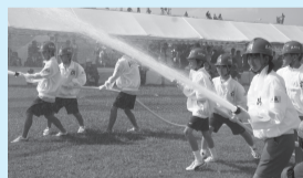
▲年数回の訓練を行っています

将来の地域防災のリーダーとなるよう、訓練を行っている中学生消火隊が総合防災訓練でD級ポンプの操法を披露します。昨年度の千寿青葉・新田・洲江・西新井中学校に加え、今年は東綾瀬・第十四中学校の2校が新たに加わりました。中学生の勇姿をぜひご覧ください。