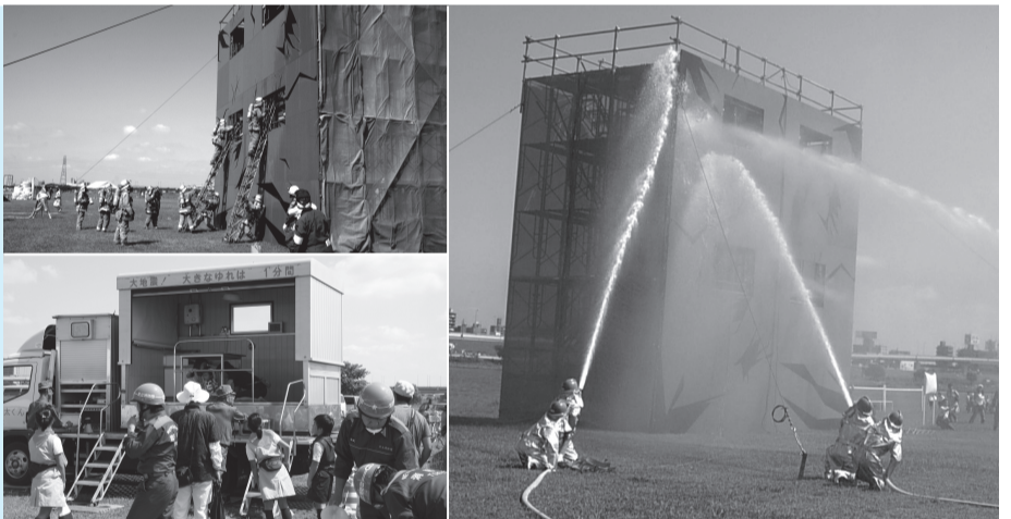
▲救出訓練(左上)や放水訓練(右)の見学のほか、起震車(左下)などの体験もできます

災害に強いまちを作るには、自分で自分の身を助ける「自助」、お互いに助け合う「共助」、区などの助け「公助」の連携が重要です。9月5日に行う「足立区総合防災訓練」に参加して、防災について考えてみませんか。