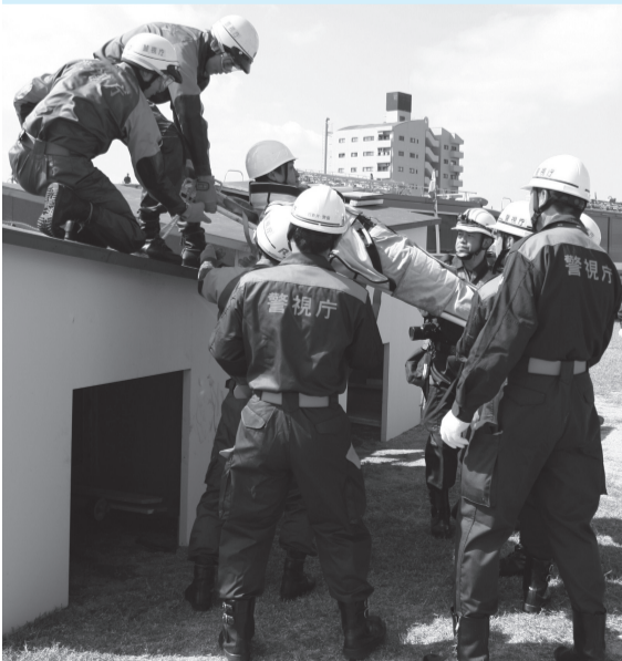
▲実際の地震を想定した訓練を行います

◆消防ヘリコプターの緊急離着陸場を開設 救急患者の迅速な搬送と、大規模災害への対応を強化するため、都立舎人公園と荒川左岸(北側)西新井橋緑地上流側に消防ヘリコプターの緊急離着陸場を開設しました。問い合わせ先=災害対策係 ☎3880-5836