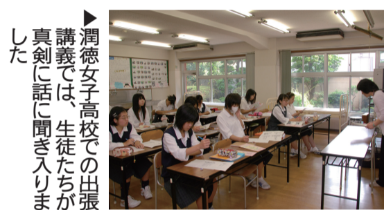
潤徳女子高校での出張講義では、生徒たちが真剣に話に聞き入りま

区では、高校生に向けて、「自分を大切にしよう」の授業を始めました。授業では、リストカットなど10代の若者の多くが自分を自分で傷つけているという現状を示しながら、「苦しいときは助けを求めてもいいんだよ」などのメッセージを伝えています。