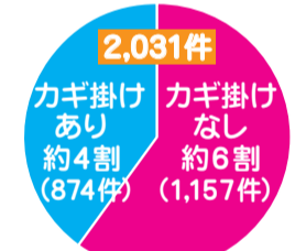
図1 区内自転車の盗難件 数のうちカギ掛けの割合

区内では、大型団地での発 生が増えており、時間帯では 終電以降の発生が増えています。 警察では、10月以降、終 電前後からの職務質問を重点 的に行います。1件でも発生 件数を抑止できるよう、全力 で取り組みます。