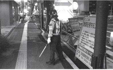
◀夜間、不審者がいないか確認する工事現場の作業員の様子

夜間の道路工事現場で防犯活動をする「地域を見守る工事現場」を、国道4号沿いの千住地区の工事現場をモデルとして試行しています。現場に看板を設置し、特定のチョッキ・腕章を着用した作業員が、不審者や不審火への目配りや清掃美化に努め、夜でも犯罪が起こりにくい環境づくりに役立っています。