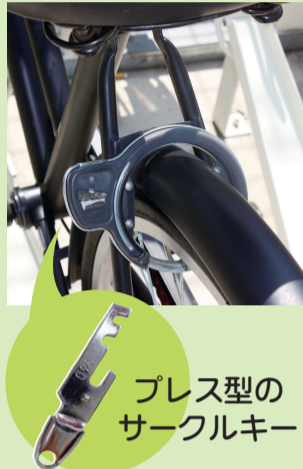
プレス型の箱型キー

このカギを使っている人は要注意! ちょっとした金具で簡単に開けてしまうから自転車泥棒の格好の標的になってしまふよ。