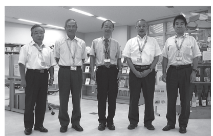
▲このメンバーが飛び込みで企業訪問を行っています

面できっと話を聞いてもらえます。相談は無料。区で行っている事業なので安心です。くわしくはお問い合わせください。問先=創業支援係(あだち産業センター内) 3870-8400